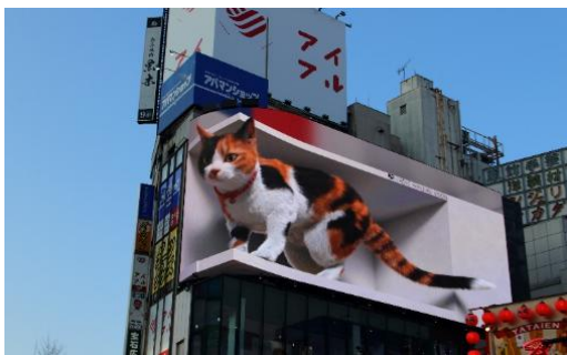
👉 พักที่ NEW OTANI INN TOKYO หรือเทียบเท่า พักใจกลางโตเกียว