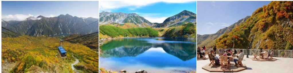
สถานีปลายทาง “ไอจิซาวะ”

และชมความแรงของน้ำที่ปล่อยออกจากเขื่อนที่ส่งเสียงดังสนั่นสู่ เมืองล่าง ไอจิซาวะ ด้านสุดท้ายของเส้นทางธรรมชาติ นำท่านโดยสารรถบัไฟฟ้า ลอดอุโมงค์ใต้ภูเขาระยะทางยาวถึง 6.1 กิโลเมตร มุ่งหน้าสู่