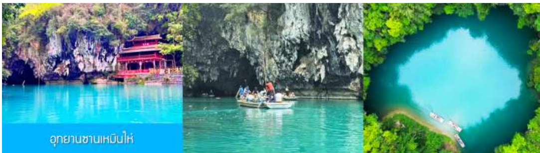
อุทยานซานเหมินไห่

เที่ยง รับประทานอาหารกลางวัน ณ ร้านอาหารใกล้เขตอุทยาน (5)