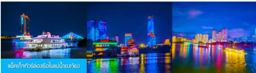
แพ็คเกจทัวร์ล่องเรือใบแม่น้ำเวินเจียง

อิสระอาหารค่ำ เพื่อความสะดวกและคล่องตัวในการเดินช้อปปิ้ง โดยท่านสามารถลิ้มลองอาหารท้องถิ่นหลากหลายรสชาติได้ตามอัธยาศัย