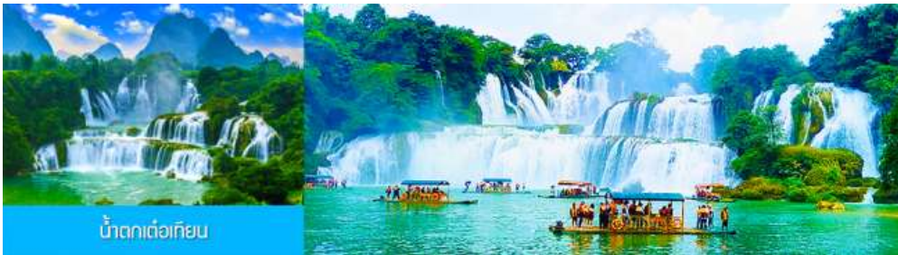
น้ำตกเต๋อเทียน