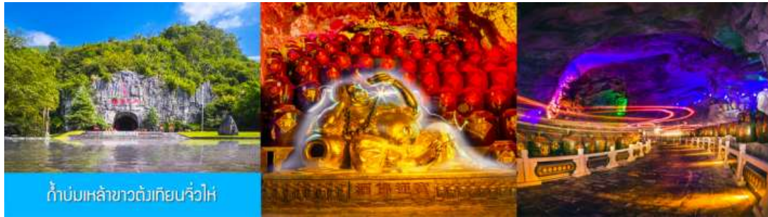
กำกับเหล่าชาวต๋มเทียบจิวไห่