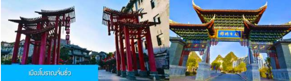
เมืองโบราณจิ่นซี