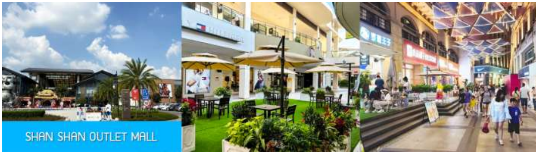
SHAN SHAN OUTLET MALL