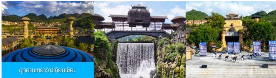
อุทยานเหยาว่างเทียนเจียะ