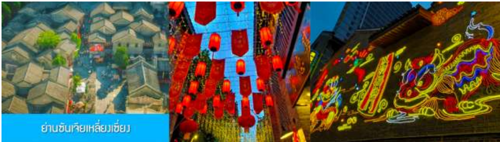
ย่านชุนเจียเหลียงเซียง

** ชำระค่าทัวร์ในนามบริษัท ไลออน ทราเวล จำกัด เท่านั้น **