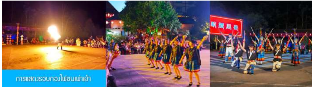
การแสดงรอบกองไฟชนเผ่าเย้า

หลังอาหารท่านสามารถชม การแสดงรอบกองไฟ 篝火表演 เป็นการแสดงพื้นเมืองของชนเผ่าเย้า (การแสดงรอบกองไฟจะจัดแสดงในวันที่สภาพอากาศไม่เอื้ออำนวย)