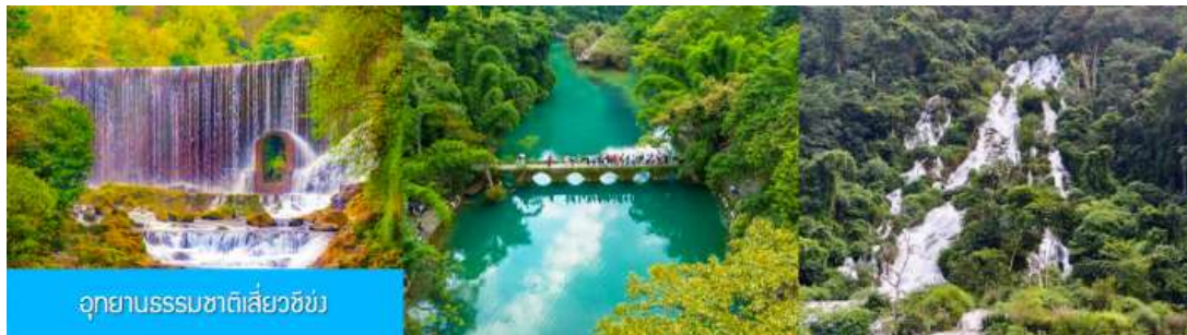
อุทยานธรรมชาติเสี่ยวซีซัง

หลังอาหารนำท่านเที่ยวชม อุทยานธรรมชาติเสี่ยวซีซัง 荔波小七孔景区 แหล่งท่องเที่ยวธรรมชาติระดับ 5A ที่ได้ชื่อว่าเป็น จิวจ้ายโกวแห่งมณฑลกุ้ยโจว โดยความสวยงามของที่นี่ไม่ได้มีน้อยหน้าไปกว่าความสวยงามของอุทยานจิวจ้ายโกว...ชมธารน้ำสีเขียวมรกตที่ไหลผ่านแกร่งหิน โขดหินธรรมชาติรูปล่างแปลกตา ร้อยเรียงเป็นน้ำตกน้อยใหญ่ที่เรียงรายถึง 68 ชั้น ชม สะพานเจ็ดรู 七孔桥 สะพานโบราณที่เชื่อมต่อมณฑลกุ้ยโจว และมณฑลกวางสีอันที่เส้นทางหลักในการลำเลียงสินค้าในยุคโบราณ และชื่อของสะพานนี้ได้กลายเป็นชื่อของอุทยานท่องเที่ยวในปัจจุบัน ชมธารน้ำลอดช่องหิน ปรากฏการณ์ที่น้ำในลำธารไหลผ่าน โกรกหินที่จับซ้อนกลายเป็นภาพที่สวยงามน่าทึ่ง นอกจากธารน้ำมรกตและธารน้ำตกน้อยใหญ่ที่ไหลผ่านหุบเขาและผืนป่า ยังมีบึงน้ำน้อยใหญ่ที่สวยงามเหนือคำบรรยาย อาทิ บึงมังกรหมอบ 卧龙潭 ทะเลสาบเยียนยังหู 鸳鸯湖 ที่ต่างก็มีความโดดเด่นและงดงามไม่แพ้กัน.....(หมายเหตุ การเดินเที่ยวชมอุทยาน สามารถเข้าทางประตูทางเข้าฝั่งตะวันตก และออกประตูทางเข้าทางฝั่งตะวันออก หรือจะสลับมาเข้าทางฝั่งตะวันออกและออกทางฝั่งตะวันตก