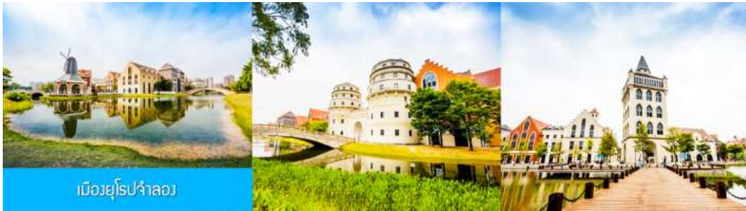
เมืองยุโรปจำลอง

** ชำระค่าทัวร์ในนามบริษัท ไลออน ทราเวล จำกัด เท่านั้น **