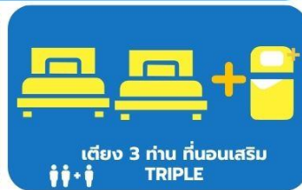
เตียง 3 ท่าน คั่นนอนเสริม TRIPLE