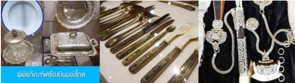
พิพิธภัณฑ์เครื่องเงินมองโกล

เช้า รับประทานอาหารเช้า ณ ห้องอาหารของโรงแรม (10)