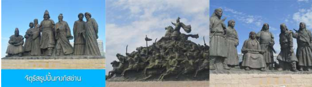
จัตุรัสรูปปั้นจอกษาน

สมบูรณ์ โครงสร้างทำด้วยอิฐ หิน และ ไม้ ประกอบด้วยห้องพัก 16 ห้อง เป็นสถาปัตยกรรมผสมแบบมองโกล ทิเบต และ ฮั่น