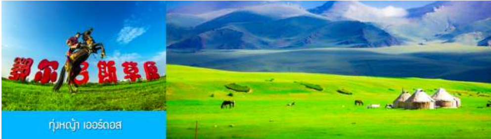
ทุ่งหญ้า เออร์ดอส

** ชำระค่าทัวร์ในนามบริษัท ไลออน ทราเวล จำกัด เท่านั้น **