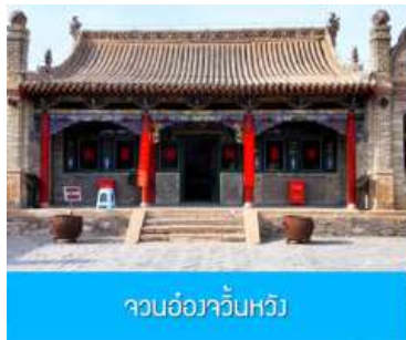
จวนอ่องจวินหวัง

เที่ยง รับประทานอาหารกลางวัน ณ ภัตตาคาร (14)