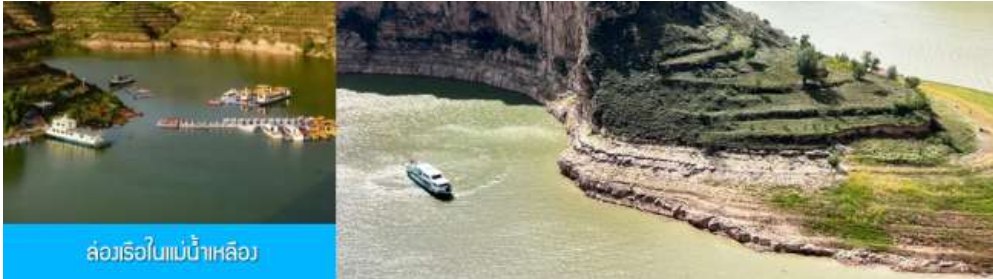
ล่องเรือใบแม่น้ำเหลือง

** ชำระค่าทัวร์ในนามบริษัท ไลออน ทราเวล จำกัด เท่านั้น **