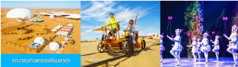
เกาะกลางทะเลทรายเขียนซาเต่า