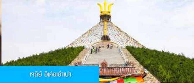
เจดีย์ อี้เค้อเอ๋เป่า