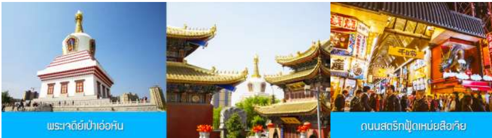
พระเจดีย์เป่าเอ่อหัน