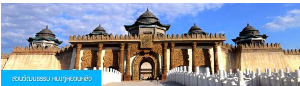
สวนวัฒนธรรม สวมกู่หยวนหลิว

หลังอาหารนำท่านเดินทางกลับเมืองเออร์ดอส (ระยะทาง 144 กม. ใช้เวลาเดินทางราว 2 ชั่วโมงเศษ)