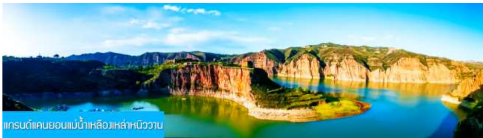
แกรนด์แคนยอนแม่น้ำเหลืองเหล่าหนิววาน

พักที่ ORDOS BOYU AIRUI HOTEL โรงแรมระดับ 4 ดาวท้องถิ่น หรือเทียบเท่าในเมืองเออร์ดอส