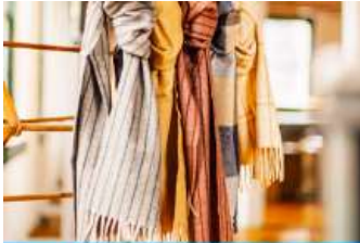
ศูนย์จำหน่ายผลิตภัณฑ์เส้นใยขนอูฐ

หลังอาหารเช้าท่านเดินทางสู่เมืองเออร์ดอส (ระยะทาง 104 กม. ใช้เวลาเดินทางราว 2 ชั่วโมง)