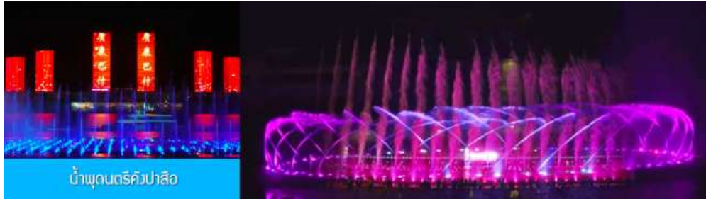
น้ำพุดนตรีกังปาสือ

หลังอาหารนำท่านชม น้ำพุดนตรีกังปาสือ 康巴什音乐喷泉 ณ บริเวณจัตุรัสกังปาสือริมแม่น้ำงูหลันหมู่หลุน ต้องบอกว่าเป็นน้ำพุดนตรี ที่ผสมผสานของน้ำพุ เสียงดนตรี แสงสี ได้อย่างลงตัวและสวยงาม ประกอบด้วย หัวฉีด 2970 หัว สปอร์ตไลท์ใต้น้ำ 1687 ดวง และเครื่องปั้มน้ำ 199 เครื่อง น้ำพุที่สูงสุดมีความสูงกว่า 200 เมตร เมื่อเสร็จจากการชมน้ำพุดนตรี นำท่านเดินทางเข้าโรงแรมที่พัก