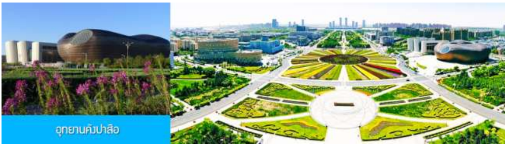
อุทยานคังปาลี