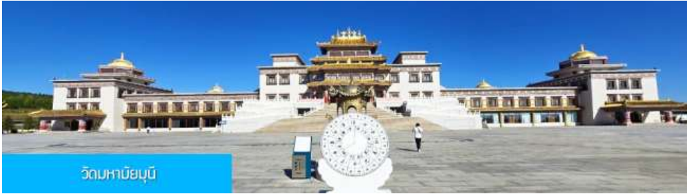
วัดหม่ามูนิ