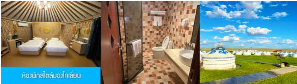
ห้องพักสไตล์บอโกเลียน