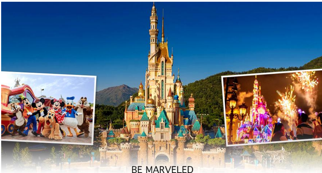
BE MARVELED HONG KONG DISNEYLAND

- Flights of Fantasy Parade ขบวนพาเหรดของบรรดาเหล่าตัวการ์ตูนดิสนีย์