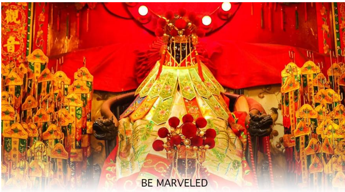
BE MARVELED วัดเจ้าแม่กวนอิมฮวงฮำ (ยิมวิน)

หรือ วันเปิดทรัพย์ เป็นความเชื่อของคนเชื้อสายจีน ทั้งฝั่งฮ่องกง และมาเก๊าถือเป็นพิธีศักดิ์สิทธิ์ในการขอพรเจ้าแม่กวนอิม เชื่อกันว่าเป็นการไหว้และการทำพิธีที่ช่วยเสริมดวงให้เงินทองไหลมาเทมา การขอยืมเงินองค์กรกวนอิมที่ขึ้นชื่อเรื่องความเมตตา หรือทำการค้า เปิดธุรกิจค้าขายเจริญรุ่งเรือง