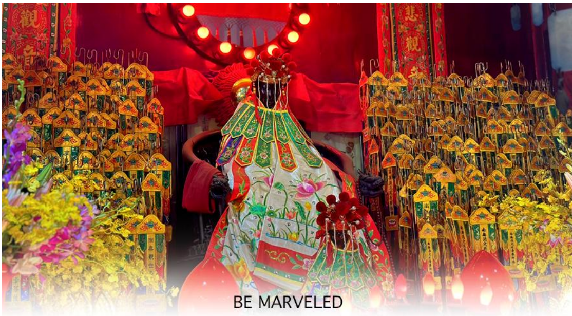
BE MARVELED วัดเจ้าแม่กวนอิมฮวงอ่า (ยิมวิน)

ให้เดินทางกลับไปกราบไหว้และขอบคุณเจ้าแม่กวนอิมอีกครั้ง โดยเตรียมชุดไหว้และกระดวยเงินกระดวยทองที่เป็นเหมือนเงินที่เรานำมาคืน เป็นการไหว้เพื่อคืนเงินเจ้าแม่กวนอิมนั่นเอง