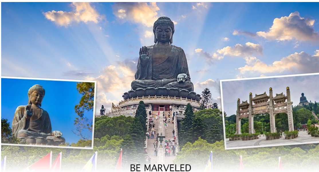
BE MARVELED พระใหญ่เทียนทาน

ใหญ่อย่างใกล้ชิดนั้น ต้องเดินขึ้นบันได จำนวน 268 ขั้นและได้รับเลือกให้เป็นสิ่งมหัศจรรย์ทางวิศวกรรมขั้นที่ 4 จากทั้งหมด 10 ชั้นของฮ่องกงในปี ค.ศ. 2000 ถือเป็นพระพุทธรูปองค์ใหญ่ที่เป็นสุดยอดของประติมากรรมทางพุทธศาสนาที่มีการผสมผสานระหว่างศิลปะสำริดแบบดั้งเดิมกับเทคโนโลยีสมัยใหม่ ชาวฮ่องกงเชื่อว่า หากใครได้มานมัสการขอพรองค์พระใหญ่แห่งนี้แล้ว ชีวิตก็จะมีแต่ความ โชคดี มีความสุขสมหวัง และประสบความสำเร็จในทุกๆด้าน หลังจากไหว้พระแล้วท่านสามารถเลือกซื้อของฝาก, ของที่ระลึก จากหมู่บ้านนงปิง อาทิเช่น หยก ไข่มุก หรือเครื่องประดับคริสตัล เพื่อเป็นของที่ระลึก จากนั้นนั่งกระเช้ากลับลงมายังสถานีตุงซุง