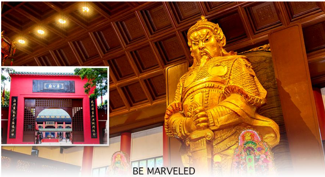
BE MARVELED วัดแชกง

นำท่านเดินทางสู่ วัดแชกงหมิว หรืออีกชื่อหนึ่งว่า “วัดกังหันลม” หนึ่งในวัดดังของฮ่องกง ที่ประชาชนให้ความเลื่อมใสศรัทธามานาน ด้านในศาลจะมีรูปปั้นสูงใหญ่ของท่านแชกง ซึ่งเป็นเทพประจำวัดแห่งนี้ เชื่อว่าองค์ท่านศักดิ์สิทธิ์ในการขอพรด้าน โชคลาภ เสริมความเป็นสิริมงคล บัดเป่าเรื่องร้ายๆออกไป และวัดแห่งนี้ยังเป็นสถานที่ที่นิยมสำหรับท่านที่ต้องการแก้ปีชงอีกด้วย โดยวิธีการไหว้ขอพรจากท่านแชกงนั้น ท่านจะต้องเข้าไปยืนอยู่เบื้อง หน้ารูปปั้นของท่าน แล้วอธิษฐานขอพรพร้อมกับมองหน้าท่านอย่างมุ่งมั่นตั้งใจ จากนั้นให้ท่านทำพิธีหมูน “กังหันแห่งโชคชะตา” หรือ “กังหันนำโชค” เพื่อหมูนรับแต่สิ่งดีๆ ให้เข้ามาในชีวิต