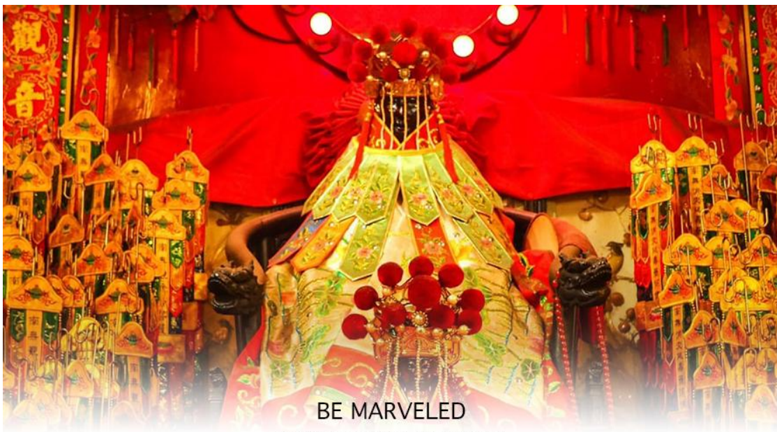
BE MARVELED วัดเจ้าแม่กวนอิมฮ่องฮ่า (ยิมวิน)

ถูกสร้างขึ้นในปี ค.ศ. 1873 ด้วยสถาปัตยกรรมแบบวัดจีนดั้งเดิม ในทุกๆ ปี จะมีนักท่องเที่ยวจากทั่วโลกแวะเวียนมากราบไหว้ รวมถึงมาร่วมพิธีขี้เงิน เจ้าแม่กวนอิมฮ่องฮ่า หรือ วันเปิดทรัพย์ ซึ่ง 1 ปีจะมีฤกษ์ดีแค่ 1 วันเท่านั้น ปี 2569 เป็นวันที่ 14 มีนาคม 2569 นี้การทำพิธีขี้เงินเจ้าแม่กวนอิม วันเปิดพระคลัง หรือ วันเปิดทรัพย์ เป็นความเชื่อของคนเชื้อสายจีน ทั้งฝั่งฮ่องกง และมาเก๊าถือเป็นพิธีศักดิ์สิทธิ์ในการขอพรเจ้าแม่กวนอิม เชื่อกันว่าเป็นการไหว้และการทำพิธีที่ช่วยเสริมดวงให้เงินทองไหลมาเทมา การขอขี้เงินองค์กวนอิมที่ขึ้นชื่อเรื่องความเมตตา หรือทำการค้า เปิดธุรกิจค้าขายเจริญรุ่งเรือง