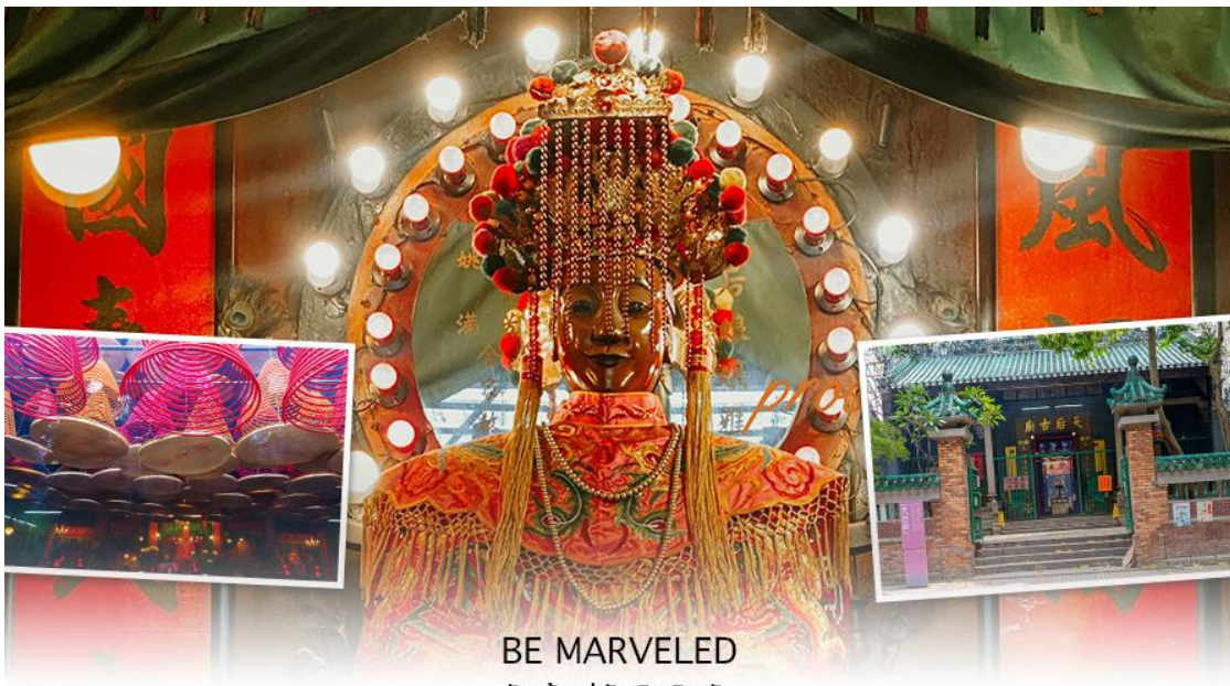
BE MARVELED วัดเจ้าแม่ทับทิมทินหัว

ทองเหลืองอยู่ด้านล่าง นอกจากการมาสักการะบูชาเจ้าแม่ทับทิมในเรื่องของการเดินทางให้ปลอดภัยแล้ว ไฮไลท์สำคัญอีกอย่างหนึ่งของวัดเจ้าแม่ทับทิม ทินหัว (Tin Hau Temple)จะเป็นขลุ่ยปี่แดงขนาดใหญ่ ที่แขวนอยู่ตามเพดานด้านในวิหารของวัดเต็มไปหมด จะยิ่งสวยงามในยามที่มีแสงแดงส่องลงมาเหมือนเป็นลำแสงส่องทะลุคลื่นรูปแปลกตา ยิ่งนัก ส่วนอาคารของวัดก็จะเป็นสถาปัตยกรรมแบบวัดจีน สร้างขึ้นตั้งแต่ปีค.ศ. 1876 โดยทางเข้าของวัดจะอยู่ติดกับสวนสาธารณะเล็กๆที่มีต้นไม้ใหญ่หลายต้น ให้บรรยากาศร่มรื่น