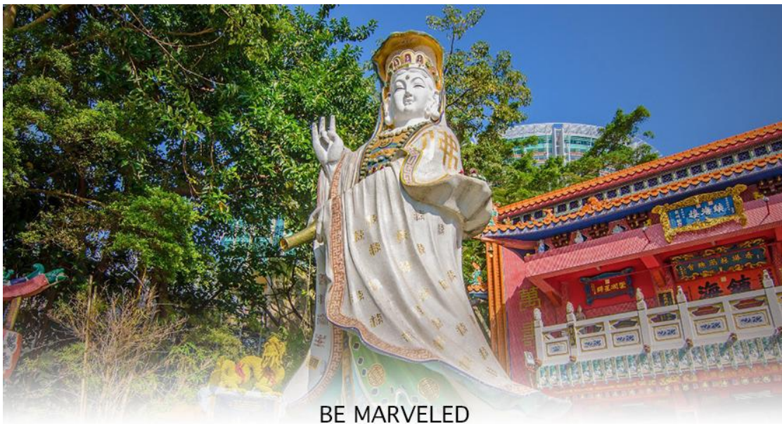
BE MARVELED วัดเจ้าแม่กวนอิมริปลัสเบย์

เรื่องการเงิน และขอพรขอโชคลาภเพื่อเป็นสิริมงคลและขอพร เจ้าแม่ทับทิม หรือ เทพธิดาแห่งท้องทะเล ซึ่งทำหน้าที่ปกป้องคุ้มครองชาวประมง ตั้งโดดเด่นอยู่ท่ามกลางสวนสวยที่ทอดยาวลงสู่ชายหาดให้ท่านนมีสการขอ และนำท่านเดินข้าม สะพานต่ออายุ ซึ่งเชื่อกันว่าข้ามหนึ่งครั้งจะมีอายุเพิ่มขึ้น 3 ถ้าข้ามแล้วห้ามเดินย้อนกลับไปได้เด็ดขาด เพราะคนฮ่องกงเชื่อว่าชีวิตจะสั้นลงไป 3 ปี สำหรับคนโตจะนิยมขอพรกับ เทพเจ้าแห่งความรัก ให้เอามือลูบที่บริเวณหินสีดำ พร้อมกับอธิษฐานให้สมหวังกับความรัก ปิดท้ายด้วยการรับพลังฮวงจุ้ยจาก ศาลาแปดทิศ ซึ่งถือเป็นจุดรวมรับพลัง ถือเป็นจุดที่มีฮวงจุ้ยดีที่สุดในของเกาะฮ่องกง และยังมีรูปปั้นองค์เทพอีกมากมายภายในวัดแห่งนี้ให้กราบไหว้ขอพร