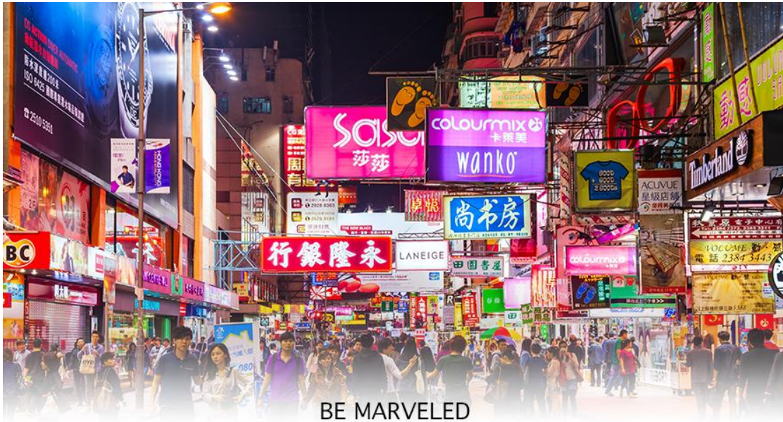
BE MARVELED TSIM SHA TSUI

** ชำระค่าทัวร์ในนามบริษัท ไลออน ทราเวล จำกัด เท่านั้น **