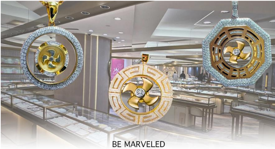
BE MARVELED ศูนย์ฮวงจุ้ย กัมหินเศรษฐี

** ชำระค่าทัวร์ในนามบริษัท ไลออน ทราเวล จำกัด เท่านั้น **