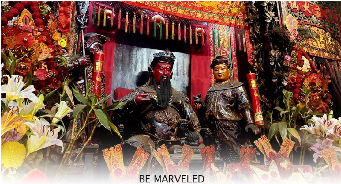
BE MARVELED วัดกวนอู

ดวงไม่ให้เพลิงพล้ำแก่ศัตรู ทำให้มีมิตรที่ซื่อสัตย์ และคุ้มครองบริวารให้ก้าวหน้าและอยู่เย็นเป็นสุข ซึ่งผู้ประกอบอาชีพ ตำรวจ ทหาร และ นักการเมือง จึงมักจะนิยมบูชาเทพเจ้ากวนอู เป็นพิเศษ