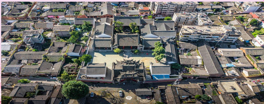
B-KMG10 BLOSSOM SNOW คุนหมิง สู่เจ้อ ซาغر้อเหลียง (MU) ม.ค.-ก.พ. 70

กลางวัน บริการอาหารกลางวัน ณ ภัตตาคาร นำท่านเดินทางสู่ สู่เจ้อ เป็นพื้นที่การปกครองระดับอำเภอ เดินทางไปยัง เมืองโบราณสู่เจ้อ เมืองประวัติศาสตร์อายุกว่า 300 ปีที่เจริญรุ่งเรืองมาตั้งแต่สมัยราชวงศ์หมิงและชิงจากการเป็นศูนย์กลางการทำเหมืองทองแดง ปัจจุบันโดดเด่นด้วยสถาปัตยกรรมดั้งเดิมที่อนุรักษ์ไว้เป็นอย่างดี มีทัศนียภาพธรรมชาติรายล้อม อีกทั้งยังมีบ้านเรือนสไตล์จีนดั้งเดิมที่ได้รับการอนุรักษ์ไว้กว่า 3,000 หลังผังเมืองถูกออกแบบอย่างชาญฉลาดเป็นรูปสี่เหลี่ยมจัตุรัส มีถนนตัดผ่านกลางหมู่บ้านโดยสถาปนิกในอดีตตั้งใจออกแบบให้มีลักษณะคล้ายกับอักษรจีนที่แปลว่า “ทุ่งนา”