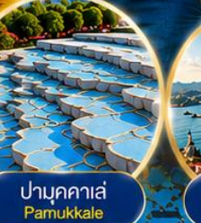
ปามุกคาเล่ Pamukkale