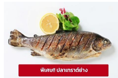
พิเศษ! ปลาเทราต์ย่าง

นำท่านเดินทางสู่ เมืองมรดกโลกเชสกี ครุมลอฟ (Cesky Krumlov) สาธารณรัฐเช็ก (ระยะทาง 210 กม./ 3.30 ชม.) ล้อมรอบด้วยแม่น้ำ Vltava ทำให้เมืองแห่งนี้มีลักษณะคล้ายหยดน้ำ จนถูกขนานนามว่าเป็น "เมืองหยดน้ำ" จากนั้นนำท่าน ถ่ายรูปบริเวณรอบนอก ปราสาทครุมลอฟ (Cesky Krumlov Castle) เป็นปราสาทกอธดั้งเดิม ตั้งอยู่ริมฝั่งแม่น้ำวัลตาवान