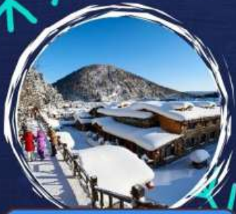
จุดชมวิวก+ฮึนฮึน