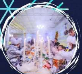
Suki Dome Ice