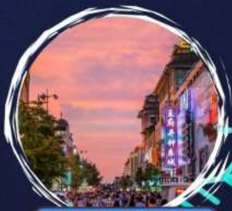
ถนนฮึนฮึน