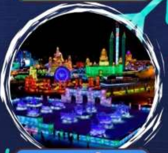
เทศกาลหิมะฮึน