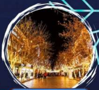
ถนนจงฮึน