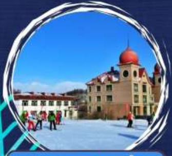
สถานศึกษาฮึน