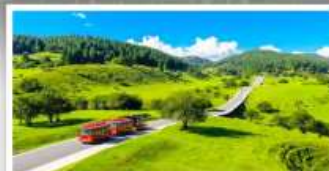
เหนางฟ้า

เดินทางโดย: สายการบินวงชิงเจียงเป๋ย (PN)