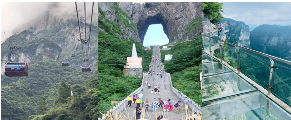
GO1CNXCKG-PN012 เชียงใหม่ ฉงชิ่ง จางเจียเจีย เมืองโบราณผู่หรง เมืองโบราณฟงหวง 6 วัน 5 คืน (PN)

กรณีที่กระเช้าหรือรถอุทยานหรือบันไดเลื่อนปิดปรับปรุงเนื่องจากซ่อมบำรุงหรือจากสภาพอากาศ ทั้งนี้เพื่อความปลอดภัยของลูกค้า ทางบริษัทฯจะจัดโปรแกรมอื่นมาทดแทนให้หรือเปลี่ยนแปลงตามความเหมาะสมอย่างใดอย่างหนึ่ง และในสถานการณ์รถของอุทยานขึ้นไปบนถ้ำประตูสวรรค์ หากรถของอุทยานไม่สามารถขึ้นไปถ้ำประตูสวรรค์ได้ ทางบริษัทฯ ขอสงวนสิทธิ์ไม่คืนเงินใดๆทั้งสิ้น โดยยึดตามประกาศจากทางอุทยานเป็นสำคัญโดยที่ไม่แจ้งให้ทราบล่วงหน้า