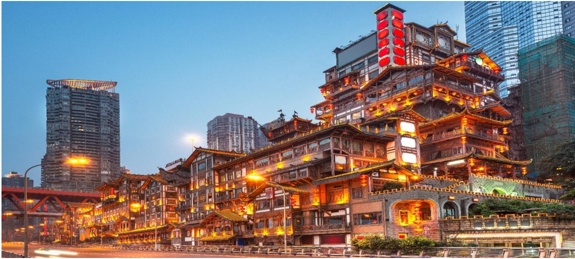
ที่พัก REZEN SUNGO HOTEL หรือระดับเทียบเท่า 4 ดาว

** ชำระค่าทัวร์ในนามบริษัท ไลออน ทราเวล จำกัด เท่านั้น **