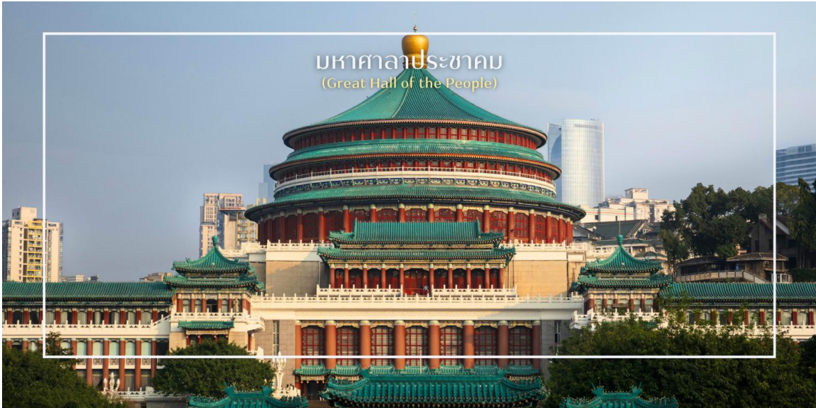
มหาศาลาประชาชน (Great Hall of the People)

นำท่านเช็คอิน นั่ง รถไฟฟ้าโมโนเรล (Monorail Train) หนึ่งในแลนด์มาร์กที่สะท้อนความทันสมัยและเอกลักษณ์ของเมืองฉงชิ่ง รถไฟฟ้าโมโนเรลสาย 2 วิ่งทะลุผ่านตัวอาคารสูงอย่างน่าทึ่ง ซึ่งเป็นวิศวกรรมก่อสร้างสุดแปลกตา กลายเป็นปรากฏการณ์ที่โด่งดังระดับโลก ท่านสามารถชมและถ่ายภาพโมเมนต์สุดล้ำนี้จากมุมต่างๆ ของเมือง จุดชมวิวนี้ไม่เพียงสร้างความตื่นตาตื่นใจ แต่ยังเป็นสัญลักษณ์ของการผสมผสานระหว่างเมืองสมัยใหม่กับภูมิประเทศที่มีภูเขาและแม่น้ำรายล้อม