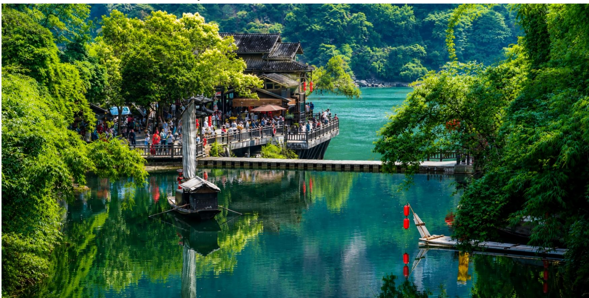
เที่ยง บริการอาหารเที่ยง ณ ภัตตาคาร (มื้อที่2)

นำท่านสู่ หมู่บ้านซานเซียเหรินเจีย (Sanxia Renjia) (รวมล่องเรือ) สถานที่นี้เป็นที่รู้จักกันในชื่อ หมู่บ้านสามผา แหล่งท่องเที่ยวระดับ 5A ตั้งอยู่ในเขตหุบเขาสามผา ริมน้ำแยงซีเกียง โดดเด่นด้วยทัศนียภาพทางธรรมชาติอันงดงามของภูเขาหินผา สายน้ำ และหุบเขาที่โอบล้อมกันอย่างกลมกลืน สถานที่แห่งนี้สะท้อนวิถีชีวิตดั้งเดิมของชาวลุ่มแม่น้ำแยงซีเกียง ผ่านสถาปัตยกรรมพื้นบ้าน วัฒนธรรม ประเพณี ที่ยังคงเอกลักษณ์ไว้อย่างครบถ้วน พร้อมให้ท่านได้ชมการแสดง เรื่องราวเกี่ยวกับวิถีชีวิตควบคู่กับสายน้ำ