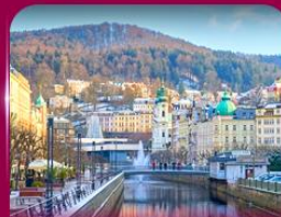
เมืองสปาแสนสวย คาร์โลว วารี