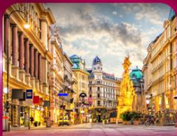
ชมเมืองโรมานติก เวียนนา