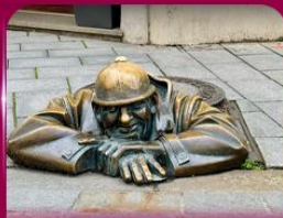
เชลฟี่คูคูมิล บราติสลาวา