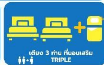
เตียง 3 ท่าน ก่อนเสริม TRIPLE