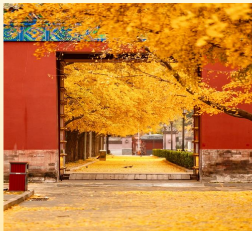
A-BJS03 Beijing's Shining ชมแปะก๊วยปักกิ่ง 5 วัน 3 คืน (CA)ต.ค.2569