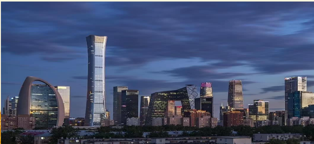
A-BJS03 Beijing's Shining ชมแปะก๊วยปักกิ่ง 5 วัน 3 คืน (CA)ต.ค.2569

01.30 น. ออกเดินทางสู่ มหานครปักกิ่ง โดยเที่ยวบินที่ CA 980 บริการอาหารและเครื่องดื่ม 07.10 น. เดินทางถึง มหานครปักกิ่ง เป็นเมืองหลวงของจีนตั้งแต่สมัยราชวงศ์จิน หยวน หมิง ชิง จนถึง สาธารณรัฐประชาชนจีน ปัจจุบันพื้นที่ของปักกิ่งมีถึง 16,800 ตร.กม. และมีประชากรประมาณ 21 ล้านคน เป็นศูนย์กลางเมือง วัฒนธรรม วิทยาศาสตร์ การศึกษาและเมืองท่องเที่ยวที่มีชื่อเสียงทั้งในประเทศจีนและในโลกร และเป็น 1 ใน 4 มหานครที่มีการปกครองแบบพิเศษของจีน ปัจจุบันปักกิ่งเป็นเขตการปกครองพิเศษแบบมหานคร 1 ใน 4 แห่งของจีน