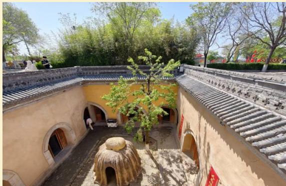
A-XIYO1B TRAIL OF THA KONG ชื่อาน ลี้หยาง หยวินชีวซาน 6วัน5คืน(ZH)พ.ย.-ธ.ค. 69