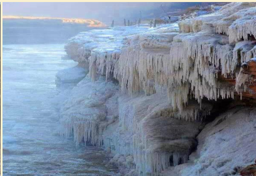
A-XIYO1B TRAIL OF THA KONG ชีอาน ลัวหยาง หยิววินชีวซาน 6วัน5คืน(ZH)พ.ย.-ธ.ค. 69