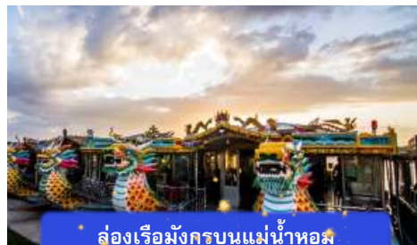
ล่องเรือมังกรบนแม่น้ำหอม

ที่พัก THANH BINH HOTEL ระดับ 4 ดาวมาตรฐานท้องถิ่น หรือเทียบเท่า