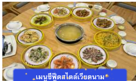
เมนูซีฟู้ดสไตล์เวียดนาม

** ชำระค่าทัวร์ในนามบริษัท ไลออน ทราเวล จำกัด เท่านั้น **