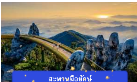
สะพานมียักษ์

เที่ยง อีศระอาหารกลางวันเพื่อความสะดวกในการท่องเที่ยว