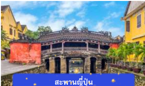
สะพานญี่ปุ่น

จากนั้นนำท่านเดินทางสู่ เมืองโบราณฮอยอัน เมืองมรดกโลกที่ยังคงเอกลักษณ์และรักษาวัฒนธรรมไว้อย่างดีเยี่ยม โดยท่านสามารถเดินเล่น ถ่ายรูป ตามตรอกซอกซอยต่างๆ ได้ ไฮไลท์ของการมาถ่ายรูปเช็คอินที่นี่คือการได้ขึ้นไปถ่ายรูปจากมุมสูงของคาเฟ่ที่อยู่ตามซอกซอย นำท่านชม สะพานญี่ปุ่น สะพานแห่งมิตรไมตรี ที่ได้ชื่อนี้เนื่องจากสะพานแห่งนี้สร้างขึ้นโดยชุมชนชาวญี่ปุ่น เป็นสะพานที่สร้างขึ้นข้ามคลองที่ในอดีต 400 ปีกว่าที่ผ่านมา