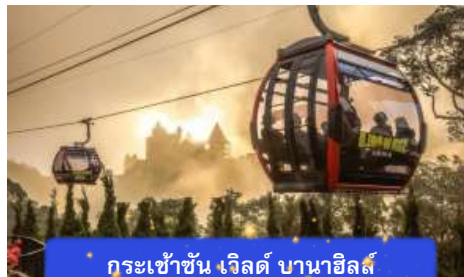
กระเช้าขึ้น เวิลด์ บานาฮิลล์

** ชำระค่าทัวร์ในนามบริษัท ไลออน ทราเวล จำกัด เท่านั้น **