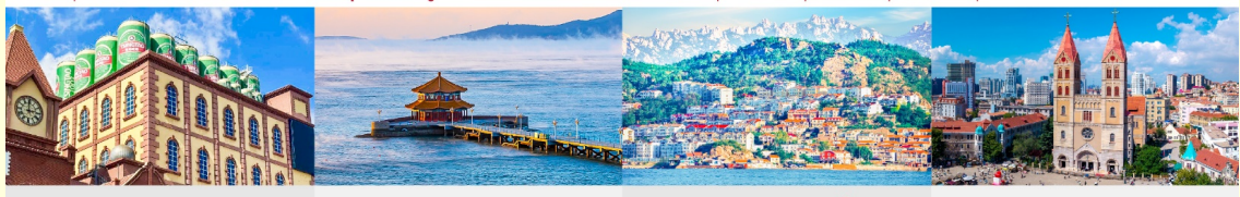
พิพิธภัณฑ์เบียร์ชิงเต่า สะพานจันเจียว หมู่บ้านชาวประมงซาจื่อโซ่ว โบสถ์คริสต์เซนต์ไมเคิล

*ทางบริษัทฯ ขอสงวนสิทธิ์ในการสลับโปรแกรมทัวร์ตามความเหมาะสมขึ้นอยู่กับสถานการณ์หน้างาน โดยคำนึงถึงผลประโยชน์ของลูกค้าเป็นสำคัญ