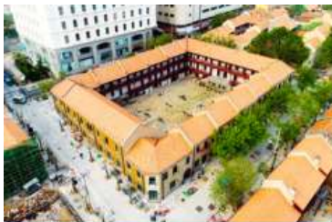
เมืองเก่าเยอรมัน ตรอกกว่างฮิงหลี่