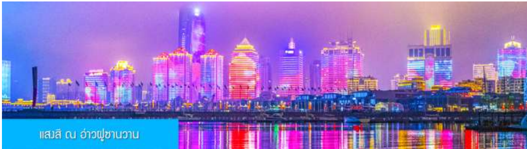
แอสสิ ณ อ่าวฟู่ซานวาน

** ชำระค่าทัวร์ในนามบริษัท ไลออน ทราเวล จำกัด เท่านั้น **