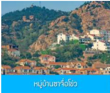
หมู่บ้านชาวประมง

จากนั้นนำท่าน เดินทางสู่ คาเฟ่อัสดง 落日古堡 นำท่านชมปราสาทในเทพนิยาย ที่ตั้งตระหง่านอยู่ริมชายหาด นานาชาติไว้ให้ คาเฟ่ที่ออกแบบด้วยสถาปัตยกรรมสไตล์ยุโรป ตัดกับวิวทะเลสีคราม และที่นี่คือแม่เหล็กดึงดูดนักท่องเที่ยวที่ชื่นชอบบรรยากาศความสวยงามความโรแมนติก ( ตัวปราสาทเป็นร้านคาเฟ่ หากท่านต้องการเข้าไปด้านใน ต้องจ่ายค่าเครื่องดื่ม ตามเมนูของทางร้าน ซึ่งไม่รวมในอัตราค่าทัวร์ )