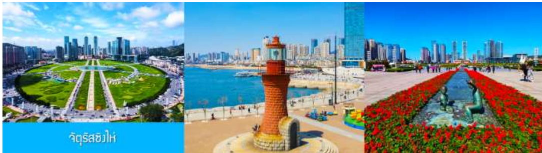
จัตุรัส星海

หลังอาหารนำท่านสู่ สวนเชอร์รี่ 櫻桃園现摘櫻桃 ให้ท่านสัมผัสประสบการณ์สุดชิล ด้วยการเด็ดเชอร์รี่สดจากต้นภายในสวนเชอร์รี่ (เชอร์รี่ของเมืองนี้จะเริ่มสุกและเก็บได้ในช่วงปลายเดือนพฤษภาคม - มิถุนายนของทุกปี ในกรณีที่ผลเชอร์รี่น้อยหรือหมดเร็วกว่าปกติ ทางทัวร์ขอสงวนสิทธิ์ในการจัด โปรแกรมอื่นแทนการเด็ดเชอร์รี่)