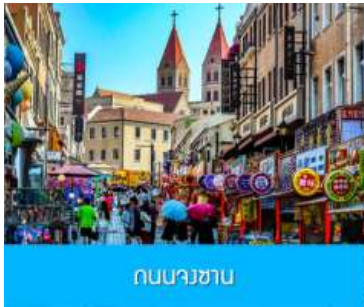
ถนนนางซาน