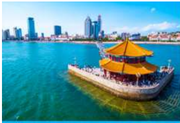
สะพานจำเป็ยิว

** ชำระค่าทัวร์ในนามบริษัท ไลออน ทราเวล จำกัด เท่านั้น **