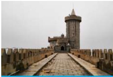
คาเฟ่อัสดง

** ชำระค่าทัวร์ในนามบริษัท ไลออน ทราเวล จำกัด เท่านั้น **