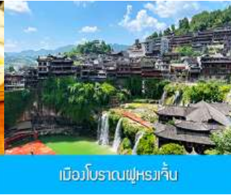
เมืองโบราณฝูหยงเจิน

วันที่สาม เมืองจางเจียเจีย-ศูนย์แพทย์แผนจีน-ศูนย์จำหน่ายผลิตภัณฑ์ไอบชา-ไกด์นำเสนอสวน OPTIONAL TOUR สะพานกระจกแกรนด์แคนยอน-เมืองโบราณฝูหยงเจินยามค่ำคืน