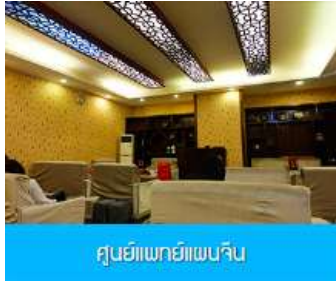
ศูนย์แพทย์แผนจีน

พักที่ HANTING HOTEL ระดับ 4 ดาวห้องดีนหรือเทียบเท่าในเมืองจางเจียเจีย