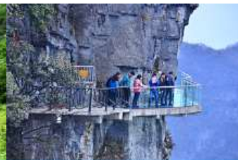
หน้าผาลอยฟ้าการเดินทาง

หลังอาหารไกด์นำเสนอสวนโปรแกรมทัวร์เสริมหรือ OPTIONAL TOUR แฝดเก็งท่องเที่ยวภูเขาเทียนเหมินซานหรือภูเขาถ้ำประดู่สวรรค์ อัตราค่าบริการท่านละ 600 หยวนหรือ 3,000 บาท อัตรานี้รวมค่าบริการเข้าอุทยานฯ รถรับส่ง กระเช้าขึ้น ลงเขาเทียนเหมินซาน ระเบียบกระเช้าเสียบหน้าผา บันไดเลื่อนทะเลภูเขา ค่าประกันอุบัติเหตุ และค่าบริการของไกด์ท้องถิ่น ระยะเวลาสำหรับแพ็คเกจประมาณ 3-4 ชั่วโมง (ขึ้นอยู่กับจำนวนนักท่องเที่ยวในแต่ละวัน)