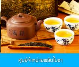
ศูนย์จำหน่ายผลิตภัณฑ์