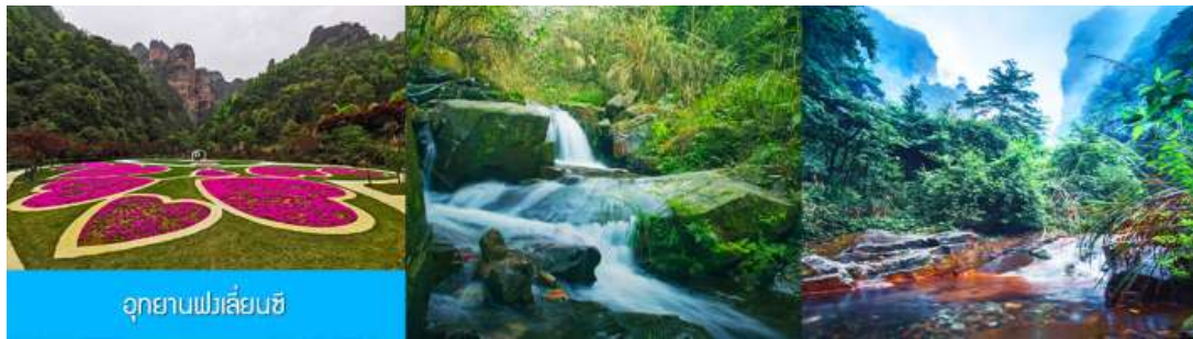
อุทยานฟงเลี่ยนซี