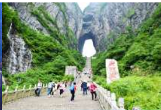
ประดู่สวรรค์