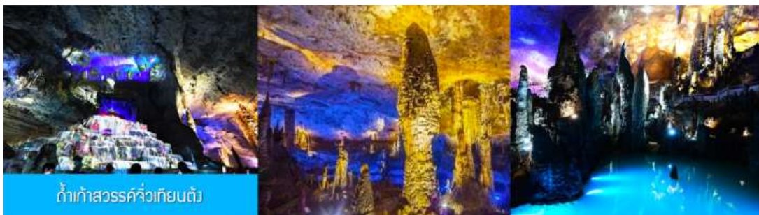
ด้าก้าสวรรค์วิญญูณถ์

พักที่ HANTING HOTEL ระดับ 4 ดาวห้องดีนหรือเทียบเท่าในเมืองจางเจียเจี๋ย