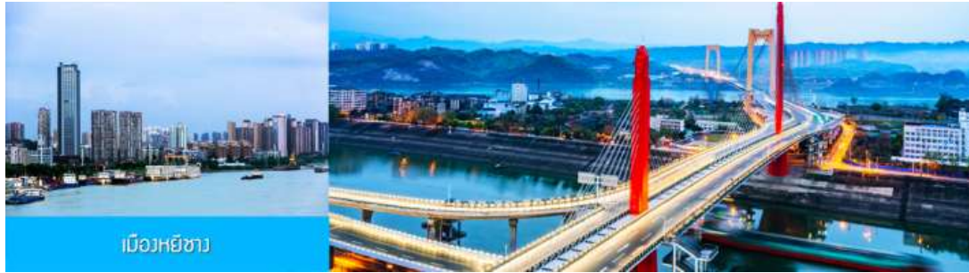
เมืองหยี่เซียง

** ชำระค่าทัวร์ในนามบริษัท ไลออน ทราเวล จำกัด เท่านั้น **