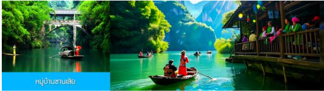
หมู่บ้านชานเสี

วันที่สอง เมืองหยี่ซาง-หมู่บ้านชานเสี-เมืองจางเจียเจี๋ย- ฝึกดำน้ำสนอ OPTIONAL TOUR ชุดชมการ แสดงสุดอลังการ