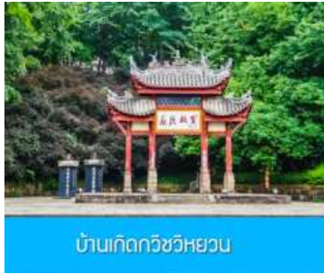
บ้านเกิดกวีชวีหยวน