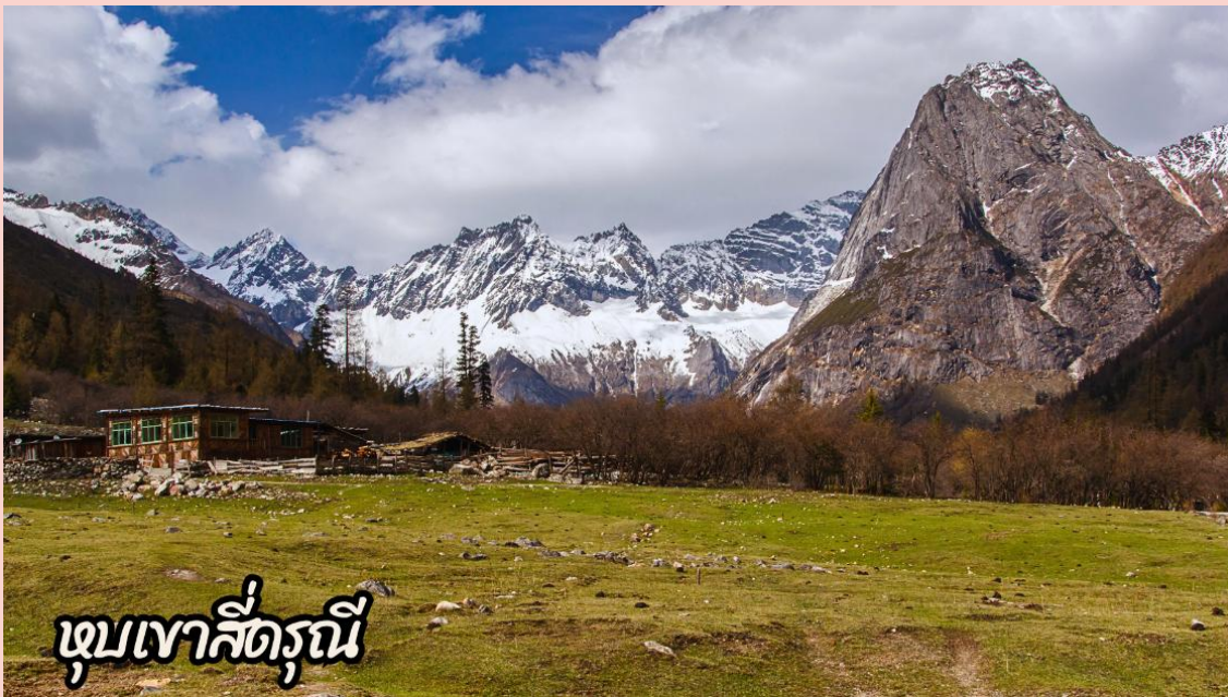
หุบเขาลี่ตงถุนี

(สถานที่ท่องเที่ยวขึ้นอยู่กับสภาพอากาศ และจุดท่องเที่ยวในอุทยานอาจมีการเปลี่ยนแปลงตามความเหมาะสม)