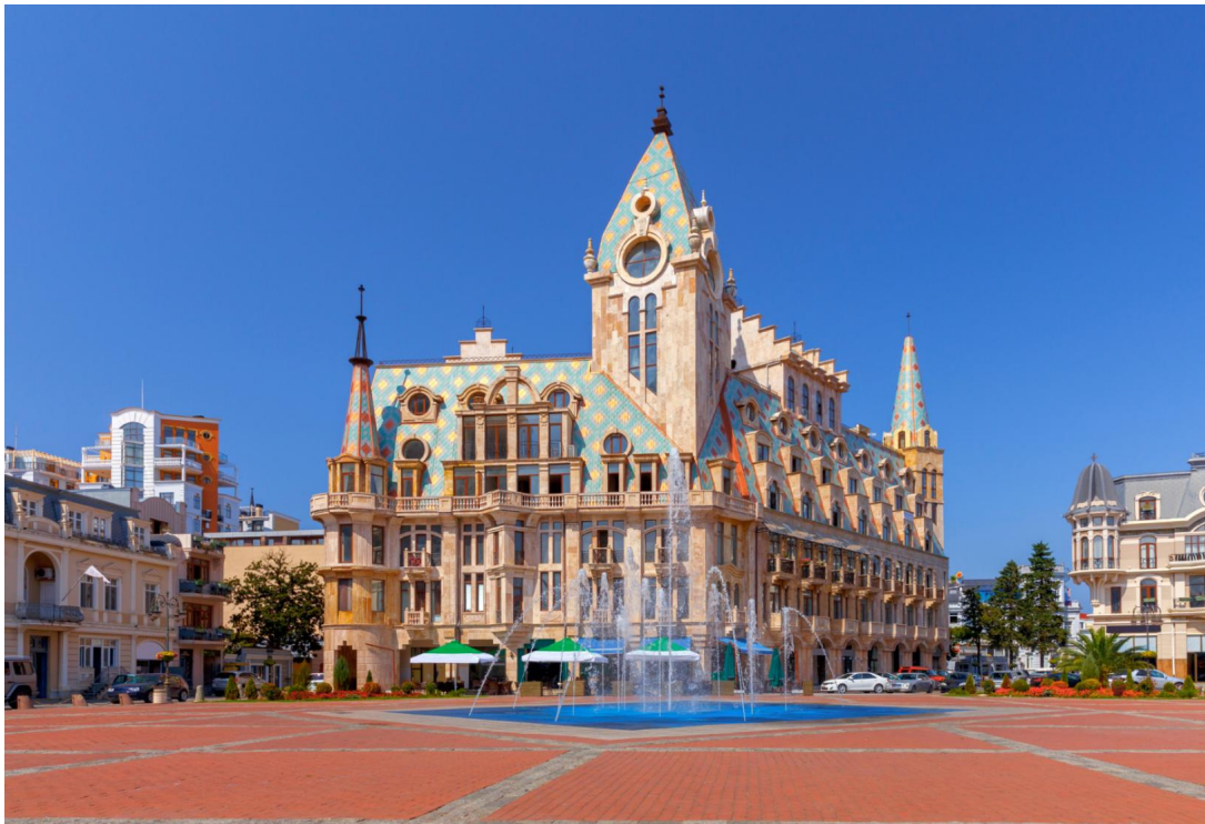
TF-TBSTK03 แกรนด์จอร์เจีย 8วัน 5คืน เที่ยวครบ คอเคซัส เข้าทบิลีซี-ออกบาทูมี ล่องเรือทะเลดำ Turkish Airlines (TK) Page 15 of 18

นำท่าน อิสระช้อปปิ้งที่ Boulevard ถนนคนเดินและแหล่งช้อปปิ้งยอดนิยมของกรุงทบิลีซี ที่นี้เต็มไปด้วยร้านค้าแบรนด์ดัง ร้านบูติกเก๋ ๆ ร้านของที่ระลึก และคาเฟ่น่ารัก ๆ ให้ท่านเพลิดเพลินกับการเดินชม ชิม และเลือกซื้อสินค้าตามอัธยาศัย พร้อมสัมผัสบรรยากาศชุมชนท้องถิ่นและไลฟ์สไตล์ของชาวเมืองอย่างใกล้ชิด จากนั้นนำท่านชม จัตุรัสเปียเซซา (Piazza Square) หนึ่งในจัตุรัสยอดนิยมของกรุงทบิลีซี ตั้งอยู่ใจกลางเมืองเก่า เป็นแหล่งรวมคาเฟ่ ร้านอาหาร บาร์ และร้านค้าสไตล์ยุโรปที่มีเอกลักษณ์โดดเด่นด้วยสถาปัตยกรรมผสมผสานแบบยุโรป-เมดิเตอร์เรเนียน และบรรยากาศที่เต็มไปด้วยชีวิตชีวา ท่านสามารถเดินเล่น ถ่ายภาพ หรือพักผ่อนที่ริมจัตุรัส เพลิดเพลินไปกับเสียงดนตรีสด และชมกิจกรรมต่าง ๆ ของชาวเมือง ทำให้จัตุรัสแห่งนี้เป็นจุดนัดพบและแลนด์มาร์กสำคัญของเมือง