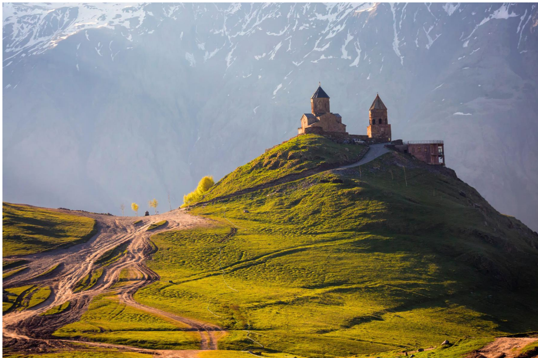
TF-TBSTK03 แกรนด์จอร์เจีย 8วัน 5คืน เที่ยวครบ คอเคซัส เข้าทบิลีซี-ออกบาตูมี ล่องเรือทะเลดำ Turkish Airlines (TK) Page 9 of 18

จากนั้นนำท่านเดินทางสู่ เมืองคاخเบก หรือชื่อปัจจุบัน สเตพานท์สมินด้า (Stepantsminda) เมืองเล็กในหุบเขาคอเคซัส ตั้งอยู่ริม แม่น้ำเทอร์เกี (Tergi River) บนความสูงประมาณ 1,740 เมตรเหนือระดับน้ำทะเล เมืองคاخเบกโดดเด่นด้วย ธรรมชาติอันงดงามและอากาศบริสุทธิ์ โดยเฉพาะในฤดูร้อนที่เย็นสบาย นำท่านเปลี่ยนการเดินทางเป็น รถจีบ 4WD เพื่อไปชมความงดงามของ โบสถ์เกอร์เกตี (Gergeti Trinity Church) ซึ่งสร้างขึ้นใน ศตวรรษที่ 14 อีกชื่อที่นิยมเรียกคือ Tsminda Sameba โบสถ์ศักดิ์สิทธิ์แห่งนี้ตั้งอยู่บน ผังเขาของแม่น้ำชเครี (Chkheri River) และตั้งอยู่บนเทือกเขาของเมืองคاخเบก ถือเป็นหนึ่งใน ไฮไลท์ทางธรรมชาติและศาสนาของจอร์เจีย