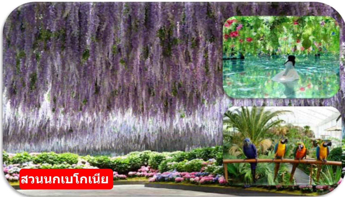
สวนนกเบโกเนีย

สวนนกเบโกเนีย เมืองคาพยอง (Begonia Bird Park) สวนธรรมชาติและเรือนกระจกขนาดใหญ่ที่ผสมผสานโลกของดอกไม้และสัตว์ปีกไว้อย่างลงตัว ภายในสวนจัดแสดง ดอกเบโกเนียหลากหลายสายพันธุ์สีสันสดใสตลอดทั้งปี ให้ท่านจะได้เพลิดเพลินกับการเดินชมสวนดอกไม้ พร้อมใกล้ชิดกับนกสายพันธุ์ต่าง ๆ