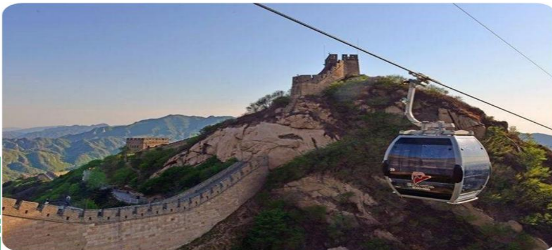
BW SAWASDEE BEIJING 5D4N (ขึ้นกระเช้า กำแพงเมืองจีน) (TG614-615) on Jun-Dec 26 สัปดาห์ 14-5-26

นำท่านเดินทางสู่ กำแพงเมืองจีน "ด่านปาต้าหลิ่ง" (นั่งกระเช้าขึ้น-ลง) กำแพงเมืองจีน ปาต้าหลิ่งเป็นที่รู้จักในฐานะด่านตรวจที่ยิ่งใหญ่ 1 ใน 9 แห่งของโลก ทศนิยมภาพของกำแพงเมืองจีนผสมผสานความสง่างามและความชันเข้ากับทิวทัศน์ที่สวยงามและเขียวชอุ่ม ถือเป็นแก่นแท้ของกำแพงเมืองจีนแห่งราชวงศ์หมิง "ผู้ที่ไม่เคยไปกำแพงเมืองจีนไม่ใช่คนแท้จริง" ชาวจีนจำนวนมากเลือกสถานที่นี้เป็นตัวเลือกหลักในการปีนกำแพงเมืองจีนด่านกำแพงเมืองจีนปาต้าหลิ่งมีรูปร่างคล้ายสี่ เหลี่ยมคางหมู ทางทิศตะวันออกแคบ ทางทิศตะวันตกกว้าง โดยมีประตู 2 แห่งทางทิศตะวันออกและทิศตะวันตก ประตูทางทิศตะวันออกมีจารึกว่า "เมืองจุหยงไวย" และประตูทางทิศตะวันตกมีจารึกว่า "กุญแจประตูทางทิศเหนือ" กำแพงเมืองจีนที่ทอดตัวไปทาง