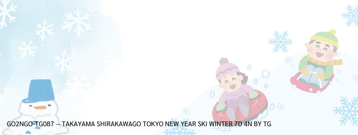
GO2NGO-TG087 -- TAKAYAMA SHIRAKAWAGO TOKYO NEW YEAR SKI WINTER 7D 4N BY TG

เมืองโฮคุโตะ (Hokuto) ตั้งอยู่ทางตะวันตกเฉียงเหนือของจังหวัดยามานาชิ เป็นเมืองที่ล้อมรอบไปด้วยภูเขาสูง เช่น ภูเขาฮัตสึงาตาเกะ เทือกเขาแอลป์ตอนใต้ ภูเขาคินบุ และภูเขาคากะงาตาเกะนอกจากนี้ยังสามารถเห็นวิวที่สวยงามของภูเขาไฟฟูจิได้อีกด้วยมีทรัพยากรธรรมชาติที่มีคุณภาพ ไม่ว่าจะเป็นน้ำแร่ เมล็ดข้าว และผลิตภัณฑ์จากนมวัว