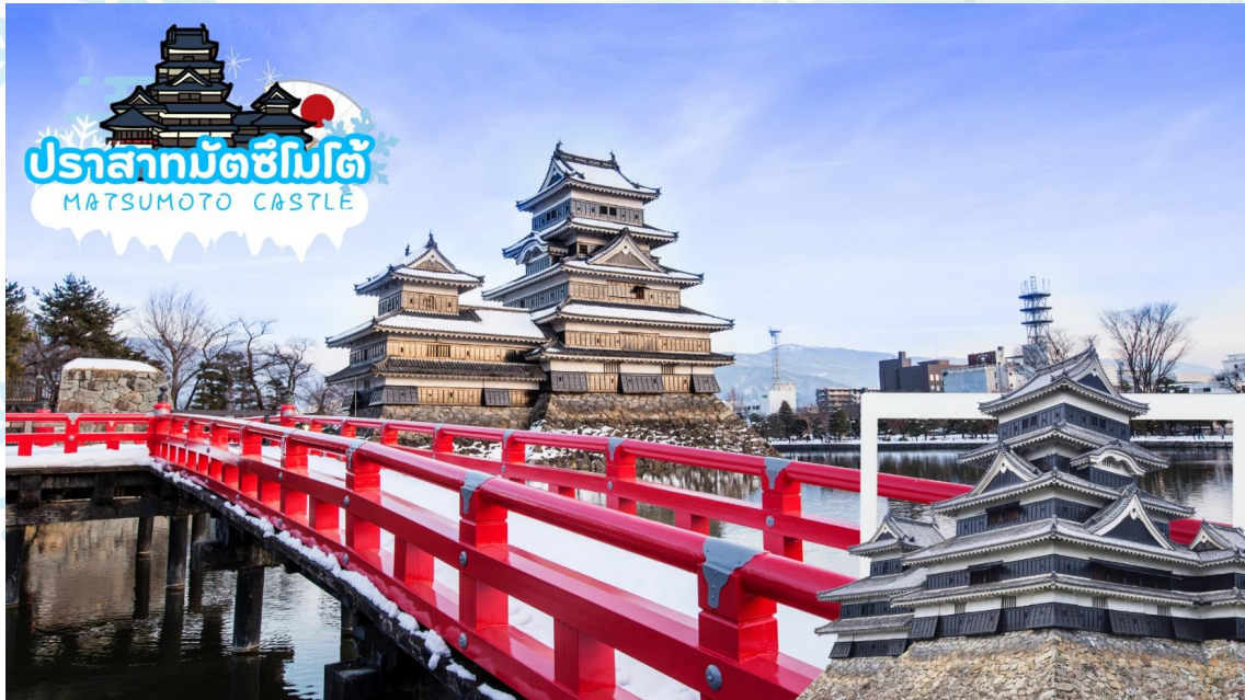
ปราสาทมัตสึโมโตะ MATSUMOTO CASTLE

** ชำระค่าทัวร์ในนามบริษัท ไลออน ทราเวล จำกัด เท่านั้น **