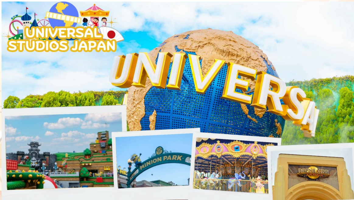
GO2HND-TG056 – TOKYO OSAKA OBARA KORANKEI AUTUMN 6D 4N BY [TG]