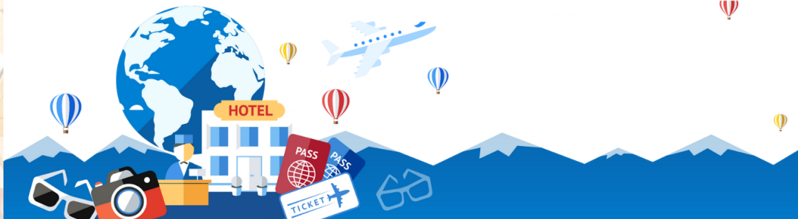
GO2HND-TG056 – TOKYO OSAKA OBARA KORANKEI AUTUMN 6D 4N BY [TG]