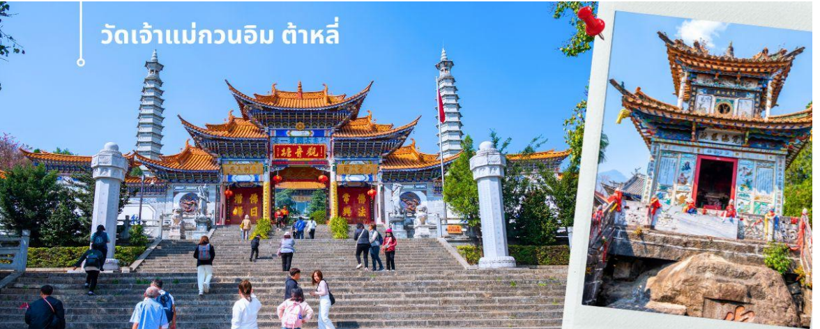
วัดเจ้าแม่กวนอิม ต้าหลี่

เช้า 🕒 รับประทานอาหารเช้า ณ ห้องอาหารโรงแรม (4) นำท่านชม วัดเจ้าแม่กวนอิม (ใช้เวลาเดินทาง 30 นาที) ตามตำนานเล่าว่าเจ้าแม่กวนอิมได้แปลงกายเป็นหญิงชราแบกก้อนหินใหญ่ไว้บนหลังเพื่อให้ทหารของฝ่ายตรงข้ามได้เห็นเมื่อทหารฝ่ายศัตรูได้เห็นว่ามีแต่หญิงชรายังแข็งแรงถึงเพียงนี้ ถ้าเป็นคนวัยหนุ่มสาวจะต้องมีพลังกำลังมากมายยกที่จะต่อสู้ จึงทำให้ไม่ทำการเข้าโจมตีเมืองและถอยทัพกลับไป ชาวเมืองจึงสร้างวัดแห่งนี้ขึ้นในสมัยราชวงศ์ถัง ซึ่งถือว่าเป็นวัดที่มีประติมากรรมยอดเยี่ยมแห่งหนึ่งในต้าหลี่