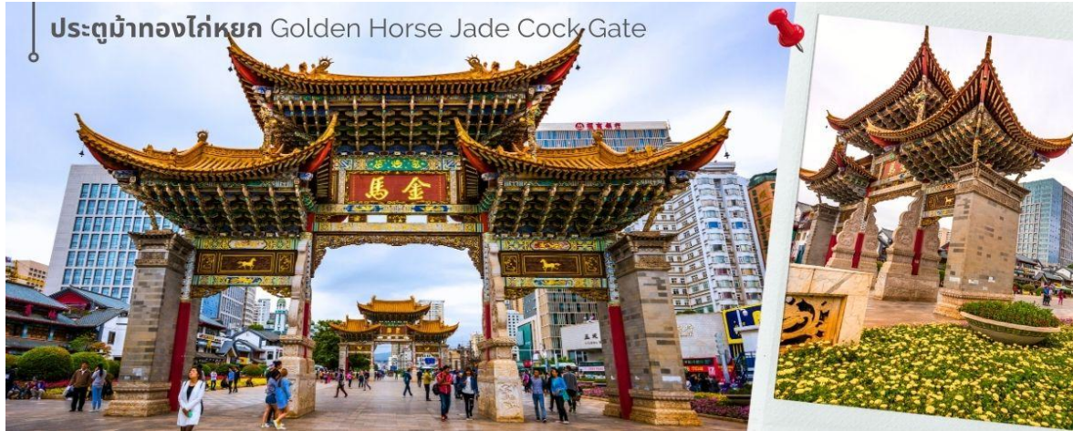
ประตูม้าทองไก่อหยก Golden Horse Jade Cock Gate

ชม ชุมประตุม้าทอง และ ชุมประตูไก่อหยก ซึ่งภาษาจีนเรียกว่าจินหมา และปี้จี จิงเอาคำย่อ จีนปี้ มาชานานนามถนน แห่งนี้ ชุมม้าทองและไก่อหยก มีอายุร่วม 400 ปี สร้างขึ้นในสมัยราชวงศ์หมิง ในถนนย่านการค้าแห่งนี้ เป็นแหล่งเสื้อผ้า แบรนด์เนมทั้งของจีนและต่างประเทศ รวมทั้งเครื่องประดับ อัญมณี ร้านเครื่องดื่ม และร้านขายของที่ระลึกมากมาย