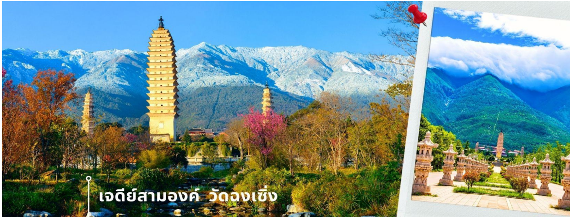
เจดีย์สามองค์ วัดฉงเซิ่ง

จากนั้นผ่านชม เจดีย์สามองค์ สัญลักษณ์ของเมืองต้าหลี่ ตั้งอยู่ภายใน วัดฉงเซิ่ง (Chongsheng Temple) วัดเก่าแก่ที่สร้างขึ้นเมื่อศตวรรษที่ 9 นับว่าเป็นหนึ่งในเจดีย์ที่สูงที่สุดในประเทศจีน อีกทั้งยังมีความศักดิ์สิทธิ์เป็นอย่างมาก ว่ากันว่าเป็นหนึ่งในสิ่งก่อสร้างเพียงไม่กี่แห่งที่ไม่ถูกทำลายจากเหตุการณ์แผ่นดินไหวในเมืองต้าหลี่เมื่อปี ค.ศ. 1925 จึงกลายเป็นสถานที่เคารพศรัทธาของชาวต้าหลี่เป็นอย่างมาก