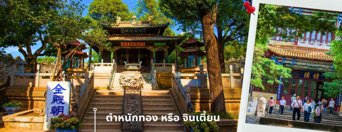
ตำหนักทอง หรือ จินเตี้ยน

เช้า 🍽️ รับประทานอาหารเช้า ณ ห้องอาหารโรงแรม (1) นำท่านเยี่ยมชม ตำหนักทอง หรือ จินเตี้ยน (The Golden Temple Park | Jindian park) (ไม่รวมค่ารถแบตเตอร์รี่ 10 หยวน/ท่าน) โบราณสถานสำคัญของมณฑลยูนนาน ที่ได้รับการปกป้องดูแลโดยรัฐบาลจีน ตั้งอยู่บริเวณเชิงเขาหมิงเฟิง ล้อมรอบด้วยแนวกำแพงและหอคอยเหมือนเป็นป้อมปราการ ตำหนักทองถูกเรียกตามลักษณะอาคารที่มีสีทองอร่าม จากทองเหลืองในส่วนของผนังและหลังคา รวมกว่า 200 ตัน โดยถือเป็นสิ่งปลูกสร้างด้วยสัมฤทธิ์ที่ใหญ่ที่สุดของจีน ภายในมีรูปปั้นทองโดยมีเงินอุ้ (เสวียนอู่) เทพเจ้าลัทธิเต๋าเป็นองค์ประธาน