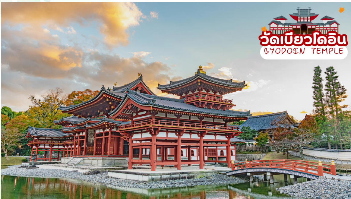
วัดเบียวโดอิน BYODOIN TEMPLE

นำทุกท่านเดินทางสู่ เมืองอุจิ (Uji) เมืองเล็กๆที่มีเสน่ห์ทางตอนใต้ของจังหวัดเมืองเกียวโต เป็นเมืองที่ขึ้นชื่อเรื่องชาเขียวอุจิมัทฉะ (Uji Matcha) และคาเฟ่น่ารักๆ ชาเขียวที่เมืองอุจิได้รับการยอมรับว่าเป็นชาเขียวคุณภาพดีที่สุดในญี่ปุ่น และยังเป็นเมืองที่เหมาะสมแก่การมาพักผ่อน เต็มไปด้วยวัดและโบราณสถานที่ได้รับมรดกโลกจากทาง Uneso