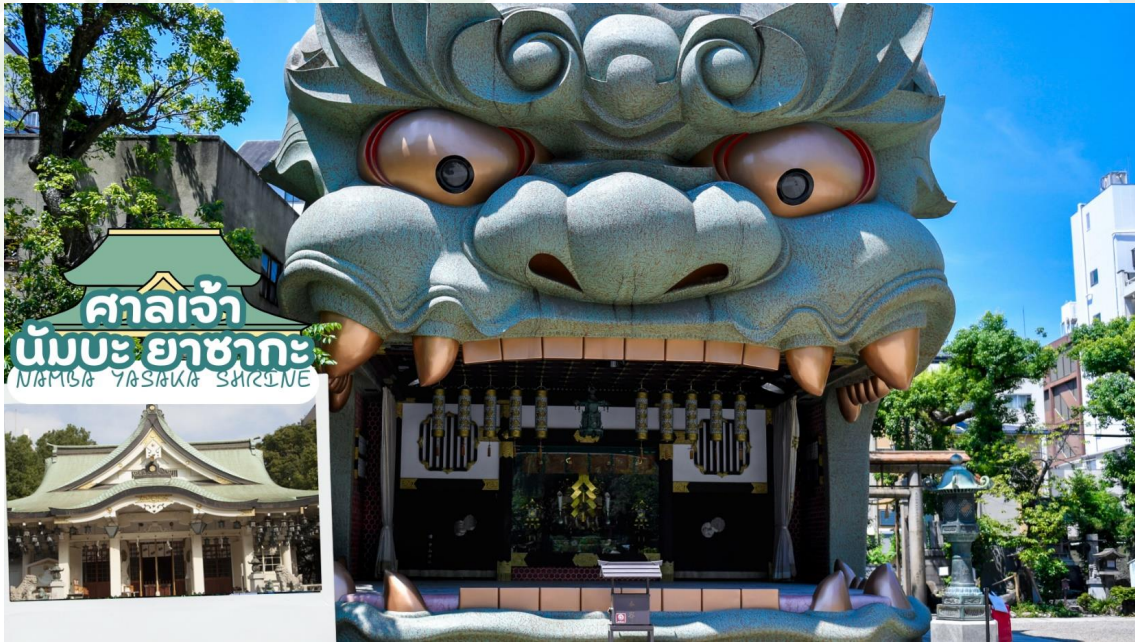
ศาลเจ้า นัมบะ ยาชากะ NAMBŌ YASHAKA SHINTŌJINE

ครั้งในภายหลัง โดยที่หัวสิงโตขนาดใหญ่ที่นับเป็นลักษณะของศาลเจ้าแห่งนี้ได้สร้างขึ้นในปี พ.ศ. 2518 เช่นเดียวกันกับสิ่งปลูกสร้างอื่น ๆ ที่มีการบูรณะขึ้นใหม่หลังได้รับความเสียหายเนื่องจากสงคราม ซึ่งมีความเชื่อว่าปากของสิงโตนั้นจะช่วยกลืนกินสิ่งที่ไม่ดี ปิดปากความชั่วร้ายให้หายไปและนำพาโชคลาภเข้ามา คนส่วนใหญ่ที่มาสักการะมักขอพรเรื่องการเรียนหรือด้านการทำงานให้เกิดความสำเร็จตามที่มุ่งหวัง