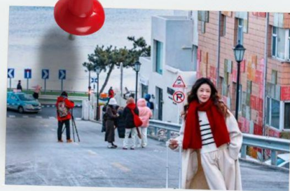
ถนนฮั่วจวีปา