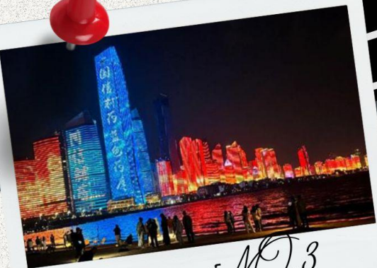
หาดไซเบอร์ MO.3