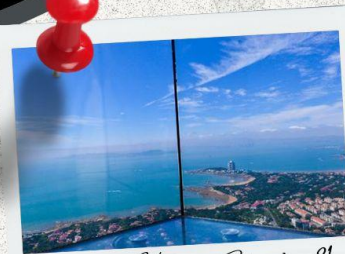
Qingdao Haitian Center ชั้น 81

** ชำระค่าทัวร์ในนามบริษัท ไลออน ทราเวล จำกัด เท่านั้น **