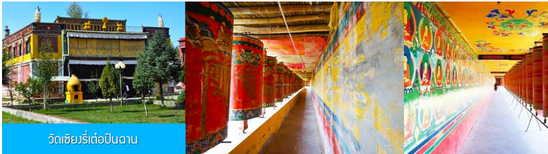
วัดเซียงรีเต๋อปีนฉาน