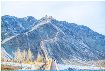
กำแพงเมืองจีนเสวียนปี