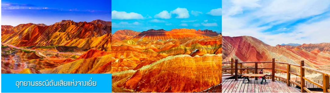
อุทยานธรณีดินสีแห่งจางเยี่ย