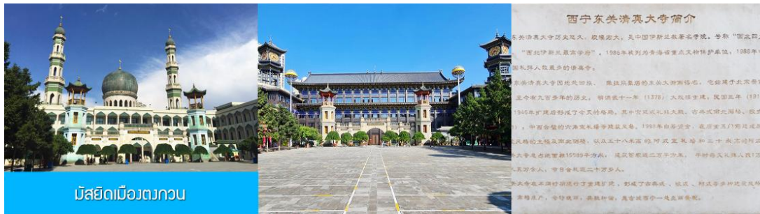
มัสยิดเมืองตงกวน

เช้า บริการอาหารเช้า ณ ร้านอาหารในโรงแรม (17)