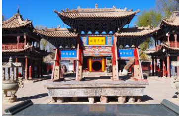
วัดพระใหญ่เมืองจางเยี่ย