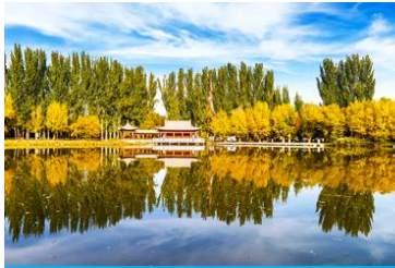
อุทยานจี้เจวียนแห่งราชวงศ์ฮั่น

จากนั้นนำท่านเดินทางสู่เมืองจี้เจวียน (ระยะทาง 50 กม. ใช้เวลาเดินทาง 1 ชั่วโมง)