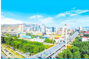
เมืองซีหนิง