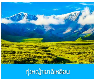
ทุ่งหญ้าเขาจีเหลียน

จากนั้นนำท่านเดินทางโดยรถบัสสู่ทุ่งหญ้าจีเหลียน (ระยะทาง 140 กม. ใช้เวลาเดินทางประมาณ 2 ชั่วโมง)