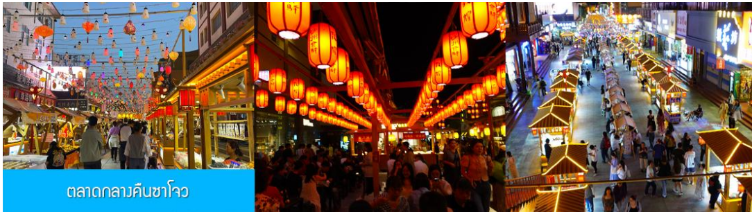
ตลาดกลางคืนซาโจว