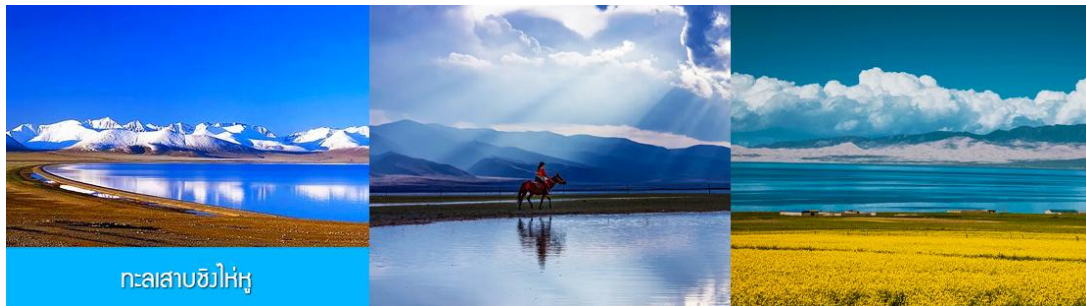
ทะเลสาบชิงไห่หู

นำท่านเดินทางสู่ ทะเลสาบชิงไห่หู (ระยะทาง 150 กม. ใช้เวลาเดินทางราว 2 ชั่วโมงเศษ)