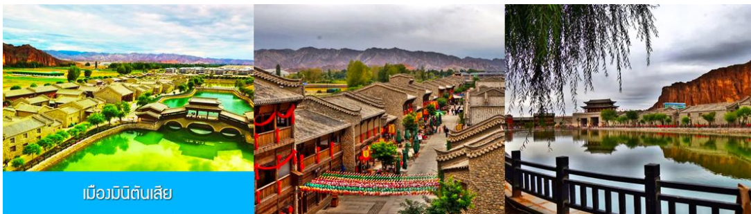
เมืองมินดินสี