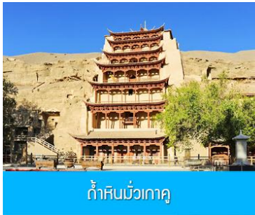
ถ้ำหินมั่วเกาหลู

เช้า รับประทานอาหารเช้า ณ ห้องอาหารของโรงแรม (9)