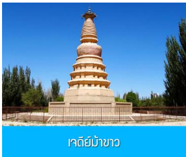
เจดีย์ม้าขาว

เที่ยง รับประทานอาหารกลางวัน ณ ภัตตาคาร (10)