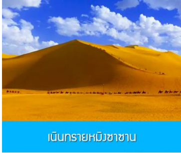
เป็นทรายหมีซาซาน

** ชำระค่าทัวร์ในนามบริษัท ไลออน ทราเวล จำกัด เท่านั้น **