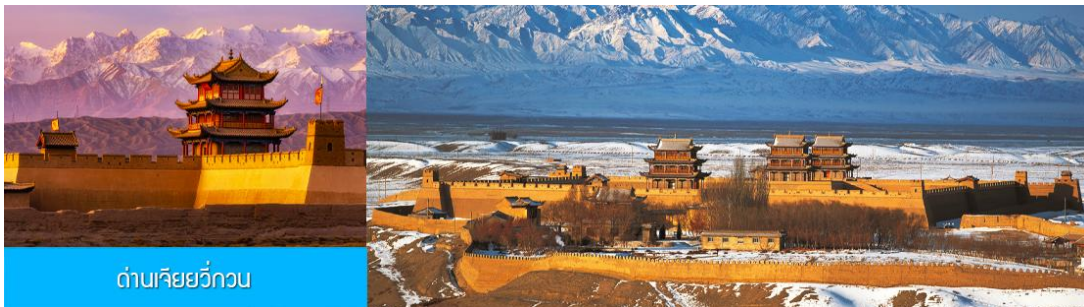
ด่านเจียชี่กวน

รับประทานอาหารเช้า ณ ห้องอาหารของโรงแรม (12)