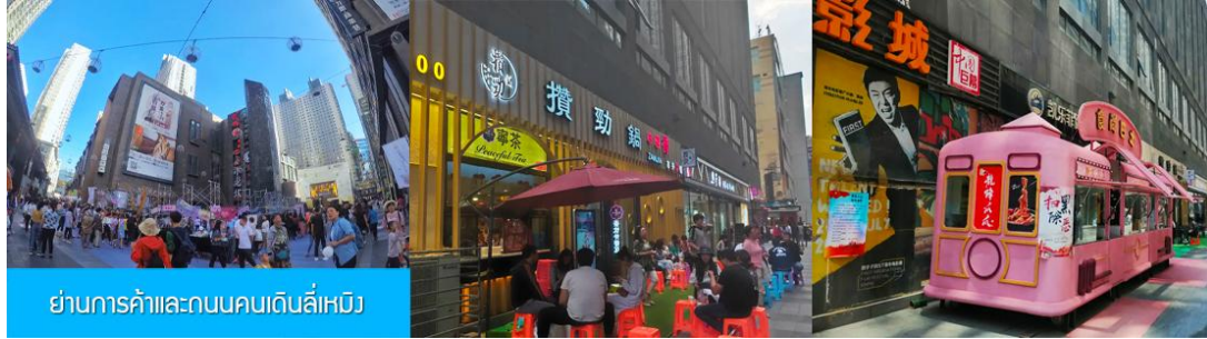
ย่านการค้าและถนนคนเดินลี่หมิง

หลังอาหารนำท่านสู่ ย่านการค้าและถนนคนเดินลี่หมิง 力盟商业步行街 ย่านการค้าทันสมัยที่มีห้างสรรพสินค้าขนาดใหญ่หลายแห่ง ถนนคนเดินที่ลึกลับไปด้วยร้านค้าแบรนด์ท้องถิ่น ร้านอาหารพื้นเมือง ร้านสะดวกทานฟาสฟู๊ด ให้เวลาอิสระท่านเดินช้อปปิ้ง ชิมอาหารพื้นเมืองเต็มที่