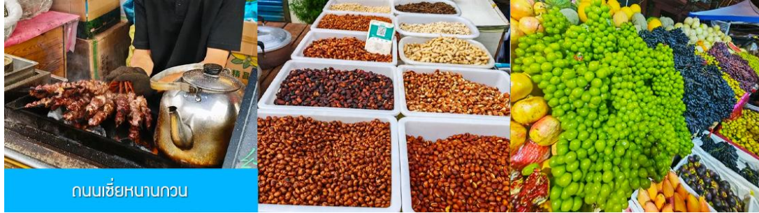
ถนนเซี่ยหนานกวน