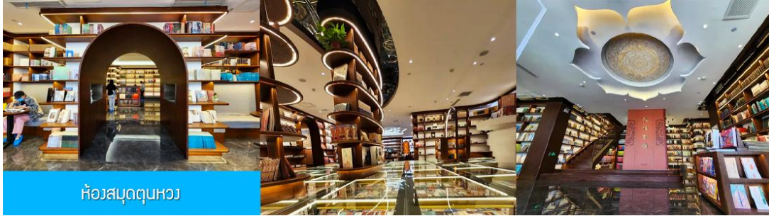
ห้องสมุดตุนหวง