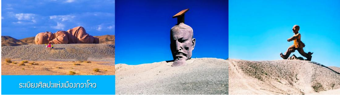
ระบียงศิลปะแห่งเมืองกวางโจว

** ชำระค่าทัวร์ในนามบริษัท ไลออน ทราเวล จำกัด เท่านั้น **