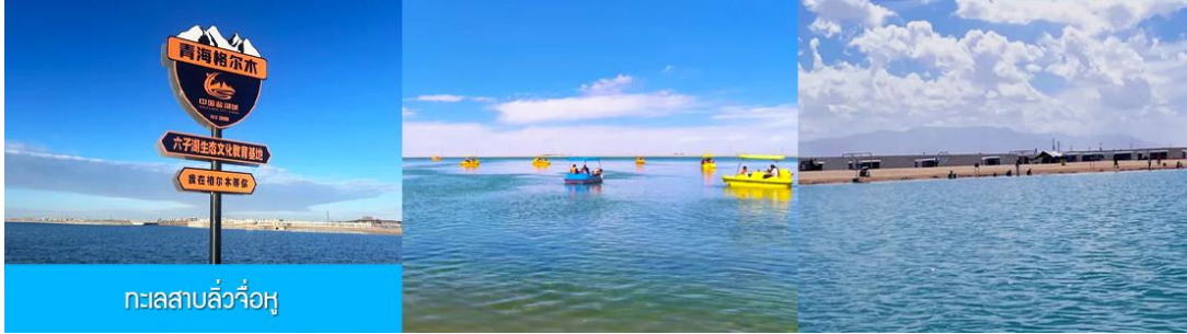
ทะเลสาบลือจื่อหู

** ชำระค่าทัวร์ในนามบริษัท ไลออน ทราเวล จำกัด เท่านั้น **