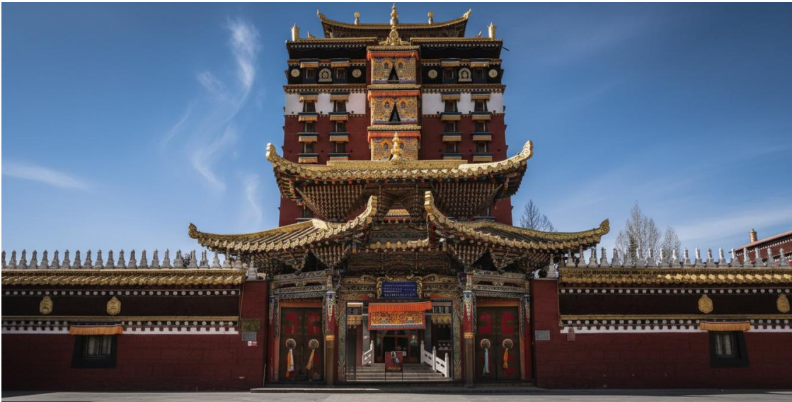
บ่าย นำท่านเดินทางสู่ หอพระมิลาเรปะ (ระยะทาง 134 ก.ม. ใช้เวลาเดินทางประมาณ 2 ชั่วโมง) สู่ใจกลางศรัทธา หอพระ 9 ชั้น มิลาเรปะ สถาปัตยกรรมทางพุทธศาสนาที่น่าอัศจรรย์ใจและเป็นหนึ่งเดียวใน

GO1LHW-MU003 เที่ยวคุ้ม สองมณฑล กานหนานแดนฝัน จิว่โจ้วโกวสวรรค์สี่คราม 8 วัน 6 คืน โดย สายการบินไชน่า อีสเทิร์น (MU)