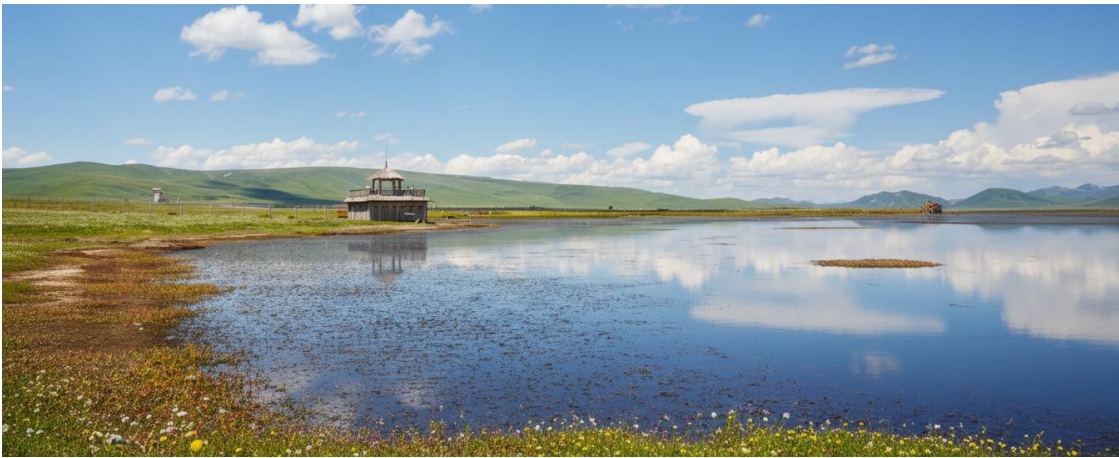
กลางวัน รับประทานอาหารกลางวัน ณ ภัตตาคาร (มื้อที่ 17)

ขจี อากาศที่น้บริสุทธิ์และบางเบา มีเพียงเสียงลมที่พัดผ่านยอดหญ้าและเสียงนกน้ำที่ขับขานเป็นท่วงทำนองแห่งธรรมชาติ บรรยากาศอันเงียบสงบจะชะล้างความเหนื่อยล้าให้หมดสิ้นไปในทันที ทะเลสาบแห่งนี้ไม่ได้เป็นเพียงความงดงามทางสายตา แต่ยังเป็นพื้นที่ชุ่มน้ำอันอุดมสมบูรณ์และมีความสำคัญยิ่งต่อระบบนิเวศบนที่ราบสูงทิเบต ถือเป็นแหล่งพักพิงและสวรรค์ของเหล่ากอพยพนานาชนิด โดยเฉพาะอย่างยิ่ง "นกกระเรียนคอดำ" สัตว์ปีกสง่างามอันเป็นสัญลักษณ์แห่งความสุขและอายุยืนยาวในวัฒนธรรมทิเบต ในช่วงฤดูร้อน พุ่มหญ้ารอบทะเลสาบจะผลิดอกไม้ป่านานาพรรณ กลายเป็นภาพวาดสีสดใสที่ธรรมชาติรังสรรค์ขึ้น เชิญท่านทอดน่องไปตามสะพานไม้ที่ทอดยาวเหนือผืนน้ำ สูดอากาศอันแสนสดชื่นให้เต็มปอด พร้อมเก็บภาพความประทับใจของผืนน้ำจรดขอบฟ้า ที่ซึ่งฝูงปศุสัตว์ของชาวทิเบตพื้นเมืองกำลังเล็มหญ้าอย่างอิสระอยู่ไกลๆ