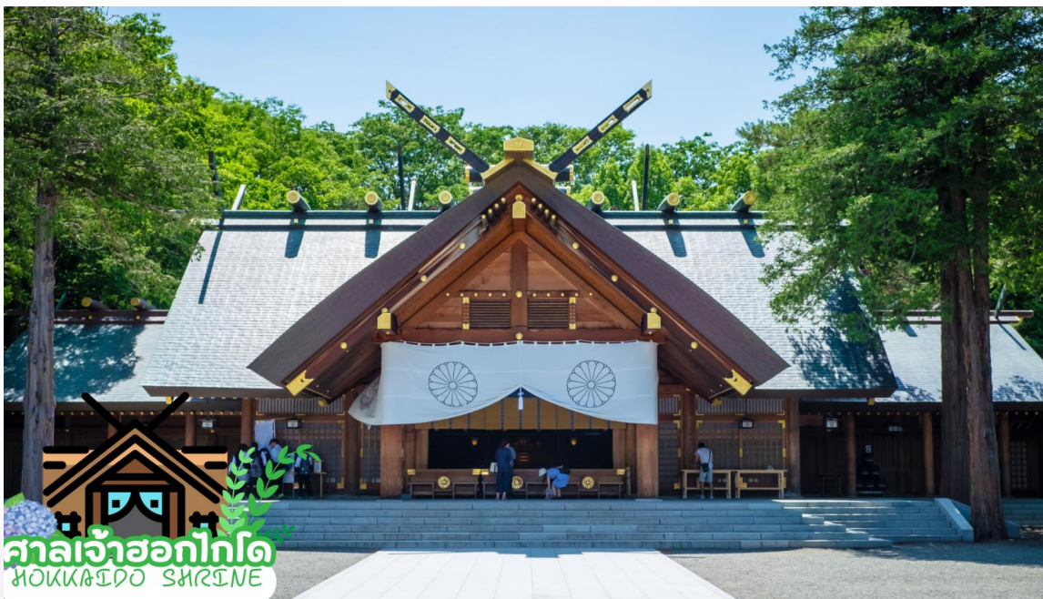
ศาลเจ้าฮอกไกโด HOKKAIDO SHRINE

นำท่านเดินทางสู่ ศาลเจ้าฮอกไกโด (Hokkaido shrine) ศาลเจ้าแห่งนี้ตั้งอยู่ที่ซัปโปโร เป็นศาลเจ้าศาสนาพุทธนิกายชินโตถือเป็นศาลเจ้าที่มีความเก่าแก่แห่งหนึ่งในเกาะฮอกไกโด ถูกสร้างขึ้นในปี ค.ศ. 1871 ในปัจจุบันก็ยังคงมีความเกี่ยวข้องกับวิถีชีวิตของชาวฮอกไกโดอย่างลึกซึ้ง เริ่มตั้งแต่การมาสักการะในวันปีใหม่ การปิดเป่ารั้งควาญ วันเซ็ตสึบุเน พิธีสมรสและอื่น ๆ เป็นต้น ในเขตศาลเจ้าที่มีธรรมชาติอุดมสมบูรณ์ มีกระรอกป่ามาเยี่ยมทักทาย