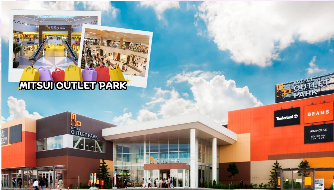
กลางวัน อิสระอาหารกลางวันตามอัธยาศัย ณ MITSUI OUTLET PARK SAPPORO

** ชำระค่าทัวร์ในนามบริษัท ไลออน ทราเวล จำกัด เท่านั้น **