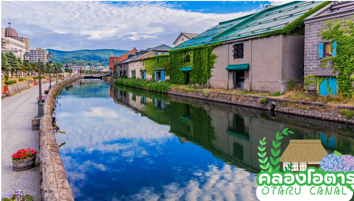
คลองโอตารุ OTARU CANAL

ชม คลองโอตารุ (Otaru Canal) ที่มีความยาว 1,140 เมตร และเชื่อมต่อกับอ่าวโอตารุ ซึ่งในสมัยก่อนประมาณ ค.ศ.1920 ที่ยุคอุตสาหกรรมการขนส่งทางเรือเฟื่องฟู คลองแห่งนี้ได้ถูกใช้เป็นเส้นทางในการขนส่งสินค้าจากคลังสินค้าในตัวเมืองโอตารุ ออกไปยังท่าเรือบริเวณปากอ่าวให้ท่านเดินเล่น พร้อมถ่ายรูปอ้อฮายัย กับอาคารเก่าแก่ริมคลองและวิวทิวทัศน์ที่สวยงาม