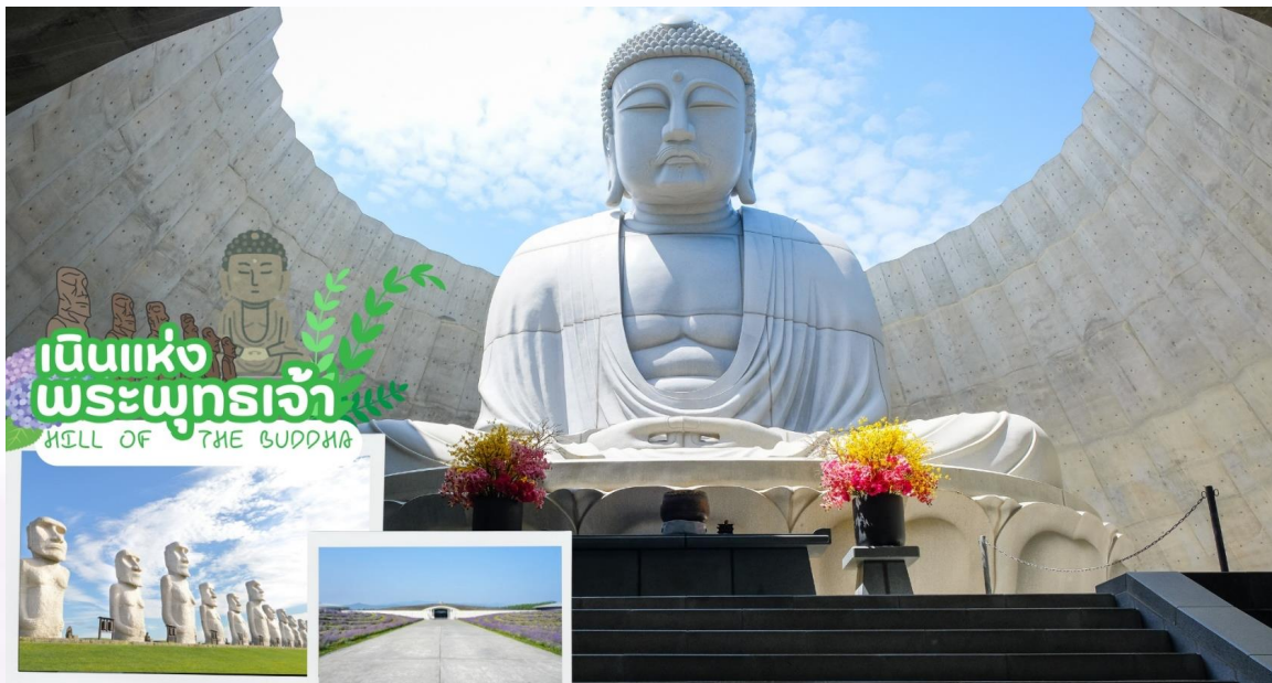
เดินแห่ง พระพุทธเจ้า HILL OF THE BUDDHA

นำท่านเดินทางสู่ เนินแห่งพระพุทธเจ้า หรือ Hill of the Buddha ตั้งอยู่ทางตอนเหนือของเมืองซัปโปโร ที่ถูกออกแบบโดย Mr.Tadao ando สถาปนิกชื่อดังชาวญี่ปุ่น พระพุทธรูปมีความสูงถึง 13.5 เมตร และมีน้ำหนักมากถึง 1500 ตัน ล้อมรอบด้วยธรรมชาติที่สวยงามแตกต่างกันออกไปในแต่ละฤดู ฤดูหนาวก็จะรู้สึกได้ถึงความงดงามของหิมะที่ขาวโพลน นับได้ว่าเป็นอีกหนึ่งสถานที่ๆเรียกได้ว่าเป็น Unseen Hokkaido เลยทีเดียว จากนั้นนำท่านชม โมอายแห่งเมืองฮอกไกโด หรือที่เรียกว่า