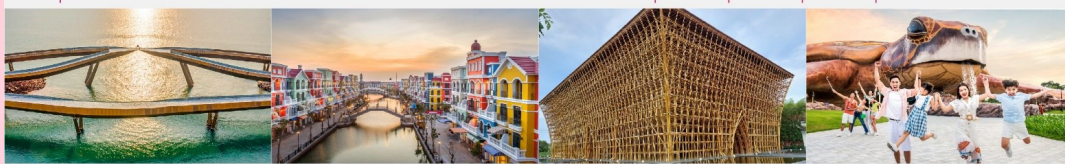
สะพานจูปิเตอร์