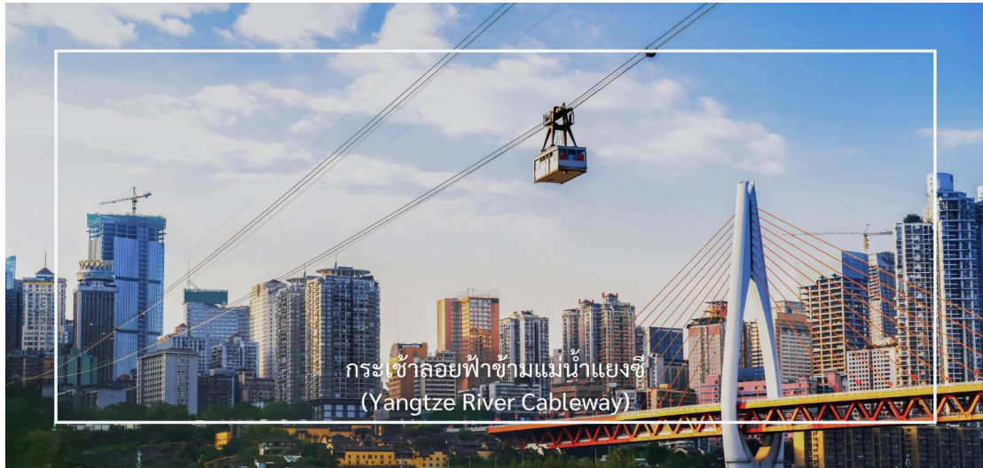
กระเช้าลอยฟ้าข้ามแม่น้ำแยงซี (Yangtze River Cableway)

สัมผัสประสบการณ์ นั่งกระเช้าข้ามแม่น้ำ (Yangtze River Cableway) สัมผัสมุมมองแบบ 3 มิติของมหานคร ฉงชิ่งที่ตั้งอยู่ท่ามกลางขุนเขา ชมเส้นสายของตึกสูง เส้นทางแม่น้ำ และแสงสีของเมืองที่ส่องประกายเหนือผืนน้ำได้แบบเต็มตา กระเช้าแห่งนี้ถือเป็นแลนด์มาร์กสำคัญและยังเป็นสถานที่ถ่ายทำภาพยนตร์ชื่อดังหลายเรื่อง เช่น Crazy Stone และ A Bite of China