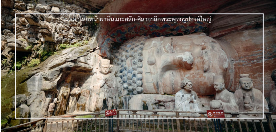
บรรดกลกหน้าผาหินแกะสลัก-ศิลาจากลึกระพุทธรูปองค์ใหญ่

** ชำระค่าทัวร์ในนามบริษัท ไลออน ทราเวล จำกัด เท่านั้น **