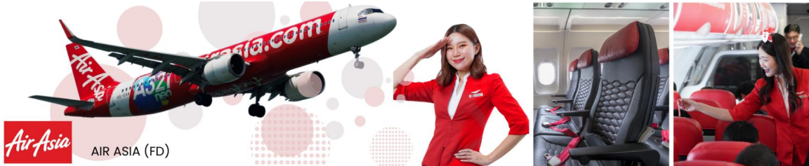
AIR ASIA (FD)

06.15 น. ออกเดินทางจากสนามบินดอนเมือง โดยสายการบิน ไทยแอร์เอเชีย เที่ยวบิน FD556