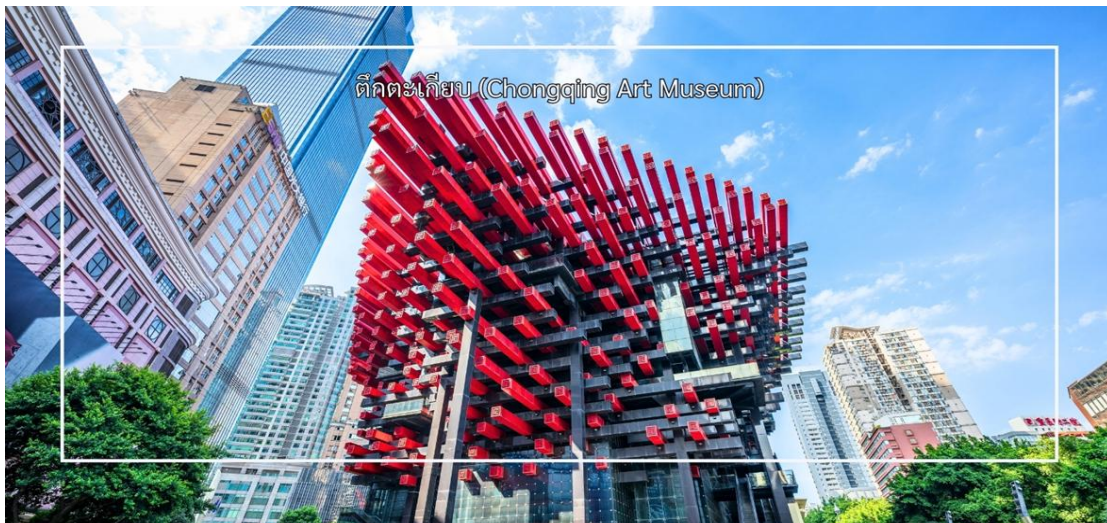
ตึกตะเกียบ (Chongqing Art Museum)

บริการอาหารเที่ยง ณ ภัตตาคาร (มื้อที่ 7)