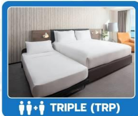
👤👤👤 TRIPLE (TRP)

**รูปภาพห้องพักเป็นเพียงภาพสื่อถึงประเภทของเตียงเท่านั้น ไม่ใช่ภาพห้องพักจริงสำหรับการเข้าพัก**