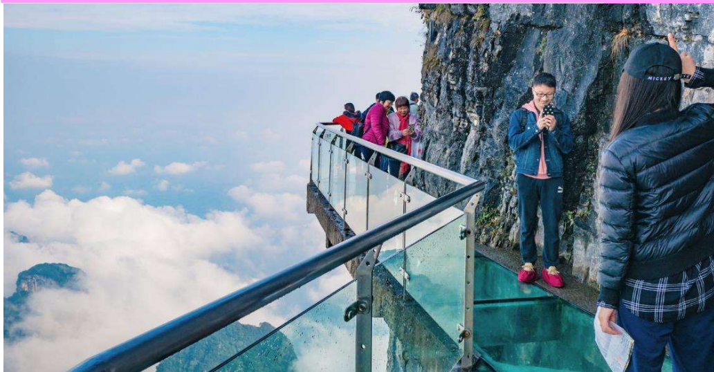
T2G-CSX14FD ฉางชา จางเจียเจีย ฟูหลงเจิน เฟิงหวง สะพานแก้ว ชมโซร်นางจิ้งจอกขาว 5D 4N (FD)

หากกระเช้าปิดซ่อมบำรุง ทางบริษัทฯ ขอสงวนสิทธิ์ไม่คืนเงินทุกกรณี แต่จะจัดหาโปรแกรมอื่นมาทดแทน โดยไม่ต้องแจ้งให้ทราบล่วงหน้า ทั้งนี้ การเปิด-ปิดให้บริการของกระเช้านั้น ขึ้นอยู่กับสภาพ ทางบริษัทฯ จะคำนึงถึงความปลอดภัยของนักท่องเที่ยว และยึดตามประกาศจากทางอุทยานเป็นสำคัญ