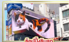
ซูปป์ิงชินจูกุ