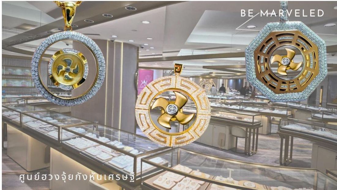
ศูนย์วงจิวelryกึ่งหินเศรษฐี

** ชำระค่าทัวร์ในนามบริษัท ไลออน ทราเวล จำกัด เท่านั้น **