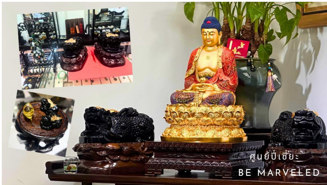
ศูนย์บีเซียะ