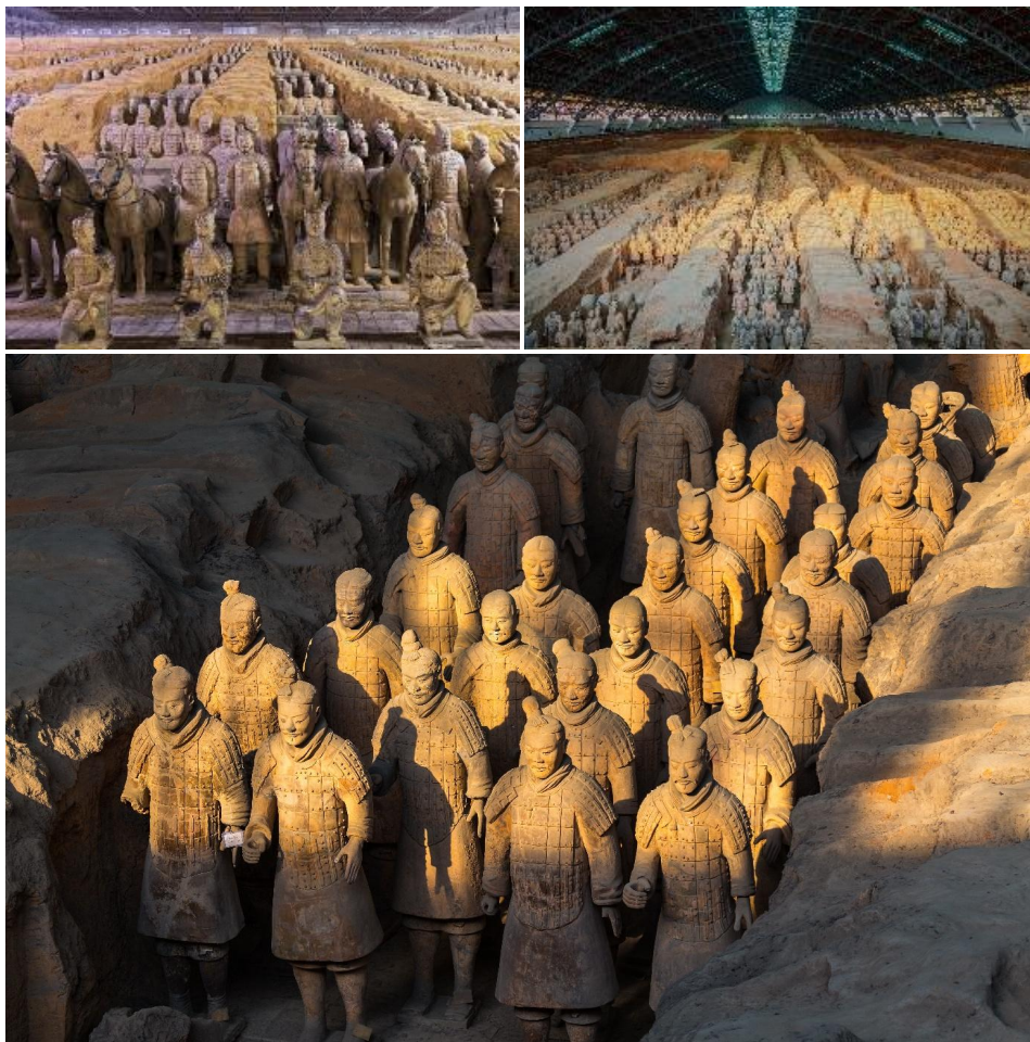
จากนั้นนำท่านสู่ เมืองขานเหมินเซีย (ใช้เวลาเดินทางประมาณ 3 ชั่วโมง)

นำท่านสู่ สุสานทหารดินเผา (รวมรถแบริดเจอร์) มหาสุสานที่ยิ่งใหญ่ของจีนซึ่งองค์ 'จักรพรรดิฉินสื่อหวง' ภายในสุสานใช้บรรจพระบรมศพของจีนซึ่งองค์ได้ โดยในระหว่างการขุดค้นนั้น บังเอิญได้พบกับซากของทหารดินเผาที่มีอายุมากกว่า 2,000 ปี ปัจจุบันมีการขุดค้นพบวัตถุโบราณ ที่เป็น กองทัพ ทหารดินเผา สรรพอาวุธ รถม้าและม้าศึก จำนวนทั้งสิ้นกว่า 7,400 ชิ้น เพื่อเป็นตัวแทนของข้าราชการบริวารในการร่วมเดินทางไปยังปรโลกของจีนซึ่งองค์ได้ ภายในบริเวณพื้นที่หลุมสุสานกว่า 25,000 ตารางเมตร คาดว่าอาณาเขตของสุสานดินสื่อหวงจะมีพื้นที่มากกว่า 2,180 ตร.กม. ซึ่งได้รับคัดเลือกให้เป็นมรดกโลกทางวัฒนธรรมในปี พ.ศ. 2530