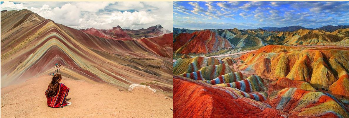
11 | Page

10.20 น. เดินทางถึง หุบเขาสายรุ้ง "VINICUNCA" สถานที่ท่องเที่ยวที่จะมานิยาม คำว่า วิหคส์ล้าน ในแบบที่ไม่เหมือนที่ไหนมาก่อน ด้วยหุบเขานั้นถอดยาวสีสังดงามเสมือนได้นำสายรุ้งมาพาดไว้กับหุบเขา เป็นวิวที่ครั้งหนึ่งต้องเห็นได้สักครั้งในชีวิต เนื่องจากมีความสูงที่สุดที่ 5,020 เหนือระดับทะเลจึงใช้ระยะเวลาสั้นๆประมาณ 30 นาทีเท่านั้น