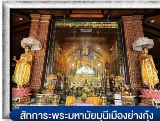
สักการะพระมหาภิรมย์บุรีเมืองย่างกุ้ง