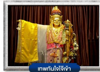
เทพทันใจใจเจ้า