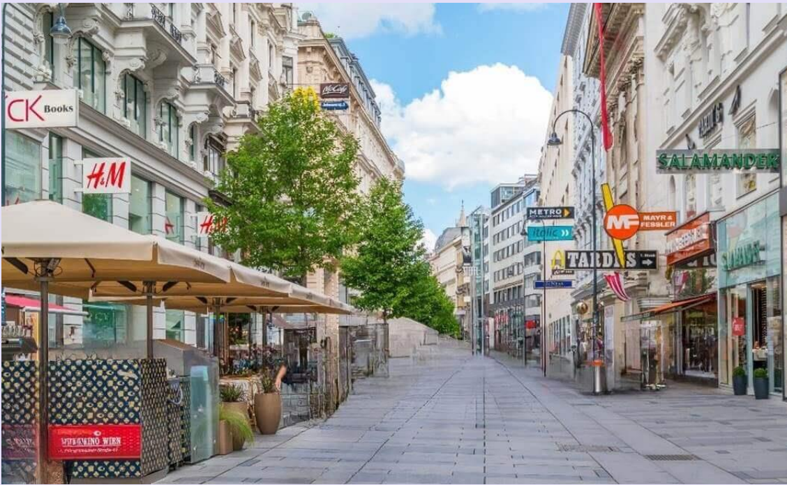
VVIE75AI-5 East Europe ถูกขนาดนี้ คุ่มจะเครซี่ 7 วัน 5 คืน BY AI (Mar-Apr 25)

จากนั้นอิสระให้ท่านได้ช้อปปิ้งแบบเต็มอิม ณ คาร์ทเนอร์สตริตซ์ (Kartner Strasse) ถนนสายนี้ปัจจุบันเปลี่ยนสภาพเป็นถนนคนเดิน ปูด้วยแนวหิน และขนบข้างด้วยอาคารร้านค้าทั้งเก่าและใหม่สลับกันไป บรรยากาศของผู้คน ร้านรวงริมทาง และอุณหภูมิเย็นสบาย กระตุ้นต่อมช้อปปิ้งของเราให้เดินเข้าออกร้านสวยอย่างไม่เหน็ดเหนื่อยเลยสักนิด ทั้งร้านขนม ร้านขายงานประดิษฐ์ และร้านขายเครื่องแก้วอื่น ๆ อีกมากมาย