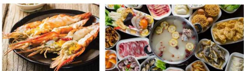
*ภาพที่ใช้เพื่อการโฆษณาเท่านั้น

เมนู สุดพิเศษ!! กุ้งแม่น้ำเผาทำนละ 1 ตัว ซาบูบุฟเฟ่ต์สไตล์เมียนมาร์ 🍴 อาหาร : 7 มื้อ