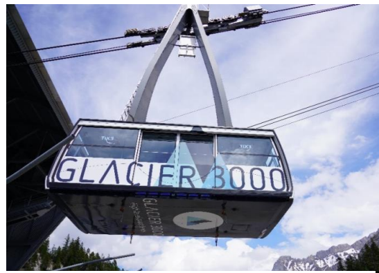
Highlight! สุดว้าว! ได้ขึ้นกระเช้าไฟฟ้าขนาดยักษ์ที่บรรจุผู้โดยสารได้ถึง 125 คน

ให้ท่านได้ช้อปปิ้งร้านนาฬิกาที่มีชื่อเสียง Kirchoffer ที่มีแบรนด์ดังกว่า 70 แบนด์ เช่น PATEK PHILIPPE, CARTIER, CHANEL, BVLGARI, HERMES และแบรนด์ชั้นนำอีกมากมาย ทั้งยังมี เครื่องประดับ, เครื่องหนัง และเครื่องสำอางอีกด้วย อีสรให้ท่านได้เลือกซื้อเลือกช้อกกันได้ตามอัธยาศัย นำท่านเดินทางสู่ หมู่บ้านโคล เดอ ปียง (Col De Pillon) (ระยะทาง 87 กม. / 1.30 ชม.) เป็นที่ตั้งของสถานี นำท่านนั่งกระเช้าลอยฟ้า สู่ ยอดเขากลาเซียร์ 3000 (Glacier 3000) มีความสูงเกือบ 3,000 เมตร เหนือระดับน้ำทะเล ชมทิวทัศน์อันงดงามของท้องฟ้าและเทือกเขามากมายแบบพาโนรามา